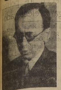
Don Arturo Alessandri Rodríguez, presidente de la delegación chilena que se reunirá en el acto de inauguración de mañana.