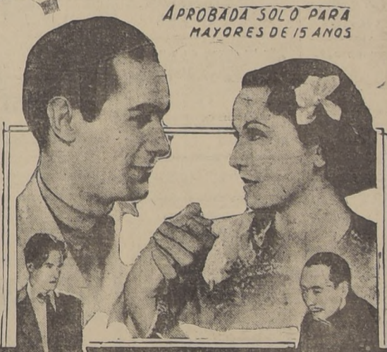
APROBADA SOLO PARA MAYORES DE 15 AÑOS

Ver esta notable producción significa penetrar a los misterios del alma compleja del Oriente. Muchas cosas que son para nosotros inexplicables hasta el momento, se hacen lógicas y comprensibles, después que esta gran película nos muestra al desnudo el alma de hombres y mujeres de razas exóticas. Es un tema emocionante, nuevo, extraño, como el mismo Oriente que lo motiva.