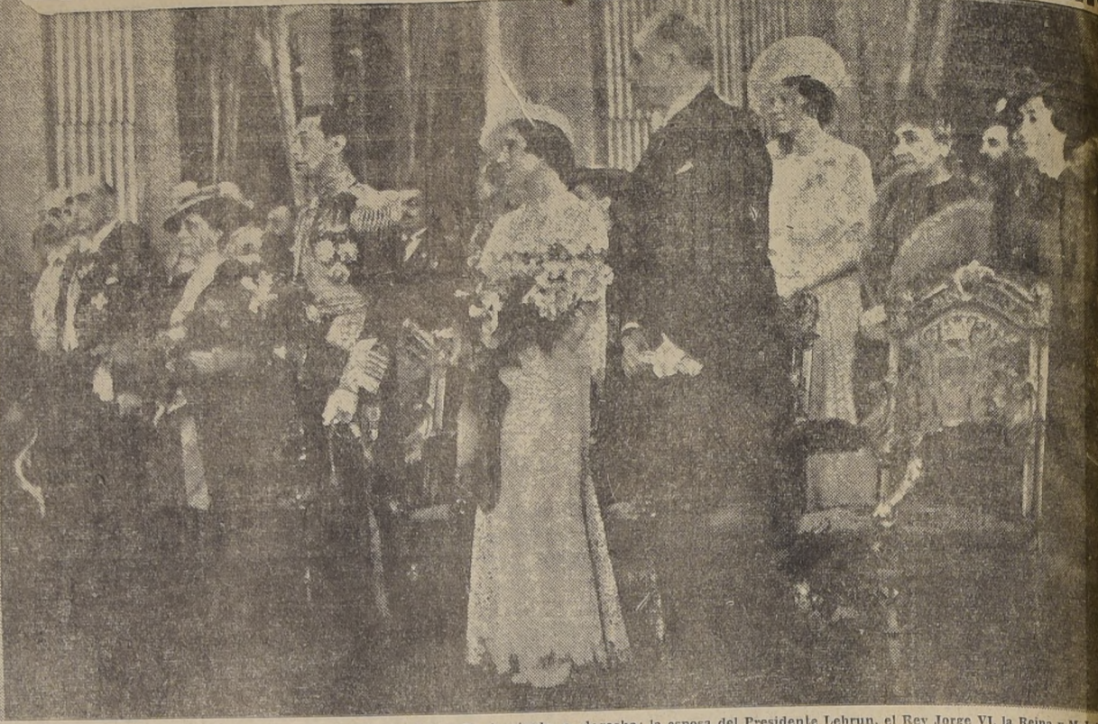
Durante la visita del Rey al Ayuntamiento de París. De izquierda a derecha: la esposa del Presidente Lebrun, el Rey Jorge VI, la Reina y M. Lebrun