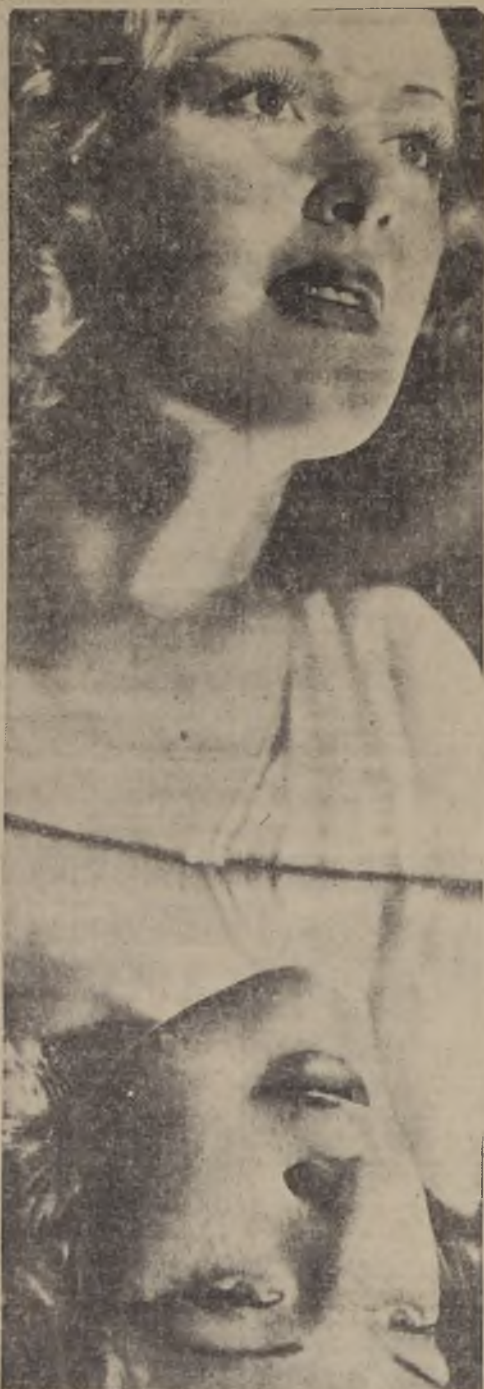
Curiosa fotografía de la encantadora artista Shirley Temple, que representa el principal papel femenino en la película "Nuevos Ricos".

Hollywood, julio de 1938. —"Nunca estuvo más linda", comentan los que observan a Shirley Temple rodando una escena de su nueva película, aun sin título.