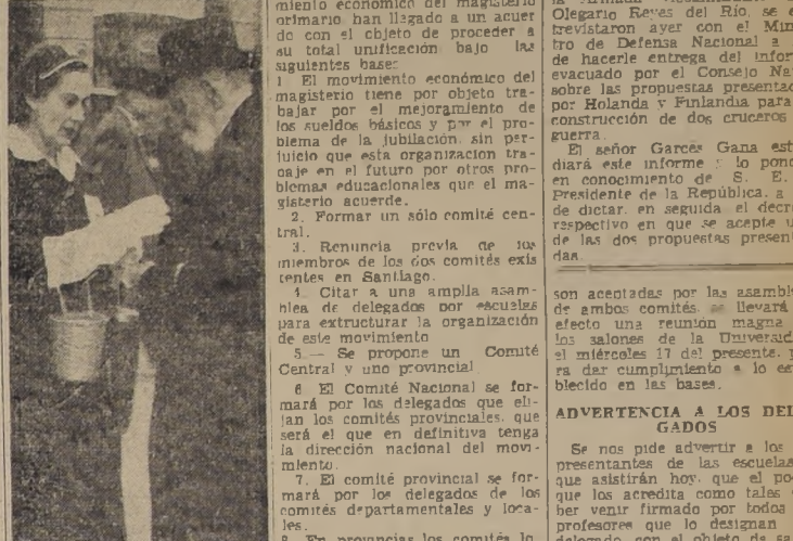
Una escena durante la colecta de ayer