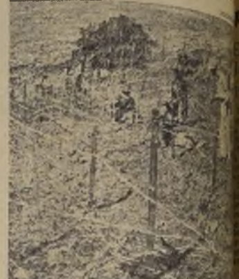
Los ingleses, protegiendo la frontera, han inventado el alambrado de púas para contener a los árabes.