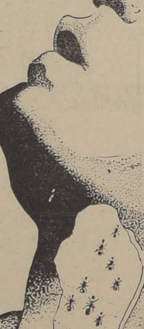
ESE HORMIGUEDO QUE NO DEJA VIVIR

Ciudad del Vaticano. — Según se ha sabido en una fuente eclesialística digna de toda fe se han iniciado negociaciones para llegar a un nuevo arreglo entre el Vaticano e Italia respecto de la disputa sobre la Acción Católica, promovida por la reciente campaña antisemítica de Italia.