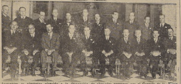
Asistentes al almuerzo ofrecido a la delegación de abogados peruanos por el Consejo de la Unión de Abogados de Chile.