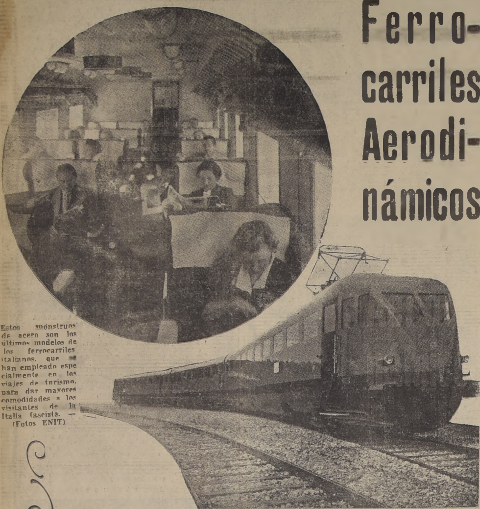
Estos monstruos de acero son los últimos modelos de los ferrocarriles italianos, que han empleado especialmente en los viajes de turismo, para dar mayores comodidades a los visitantes de Italia fascista.