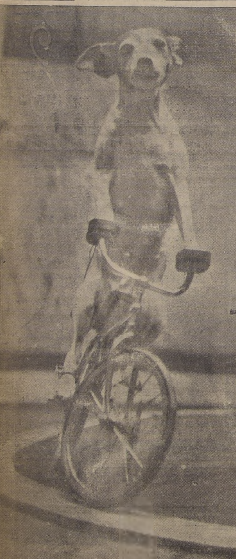
Los perros progresan indiscutiblemente y aquí tenemos un ejemplo visible. Este camina en bicicleta alrededor de una pista, sin salirse de la angosta ruta trazada.