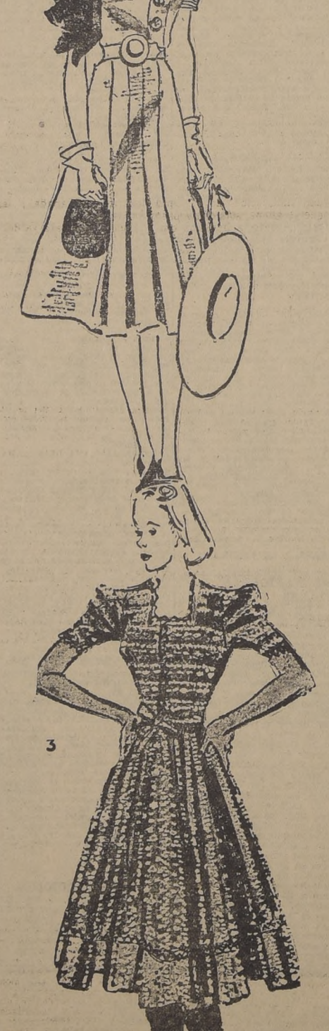
1. Pollera y bolero en laínage azul Wally, bordado con hilos metálicos. Blusa de linón rosa.—2. En franela rosa; pespunte, botones y pañuelo bordeaux. Guantes de piel de Suecia, rosados. Cartera en box-calf bordeaux.—3. En encaje de lana malva, con picots en gros-grain celeste

Preparación: déjese la gelatina durante 5 minutos en agua fría. Disuélvase luego en el agua hirviendo. Déjese enfriar y espesarse ligeramente. Agréguese el resto de los ingredientes. Viértase en un molde. Déjese helar hasta que se asiente. Desmóldese en una fuente, sobre berros.