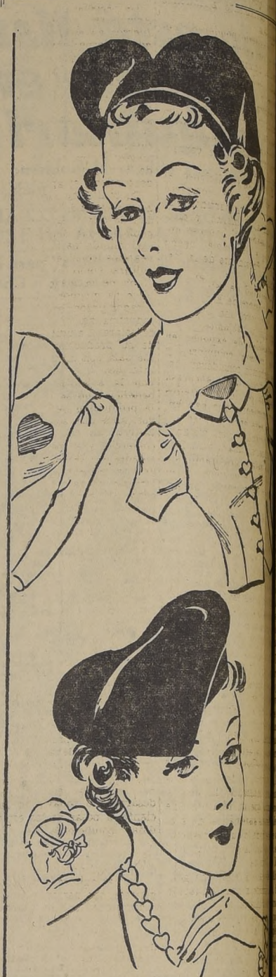
París ha lanzado la moda de las figuras de naipes en los trajes femeninos y especialmente en los sombreros. Aquí vemos dos "mas de pique" muy modernos.

do para cualquier clase de muebles modestos. Una salita alargada, por lo general, tiene alguna esquina que se presta maravillosamente al uso de dos bancos forrados de cuero. La luz, que es un elemento importante en la colocación del juego de muebles, no debe olvidarse. El más conveniente y mejor tipo de iluminación es el indirecto, que puede ser prestado por una sola lámpara de pie, de las que proyectan la luz hacia el techo, o por pequeñas lámparas de pared. Tal vez, la lámpara de pie sea la más práctica; pues puede hacerse armonizar con el resto del mobiliario y es un bonito adorno en sí misma. PARA GUARDAR LOS UTENSILIOS DEL JUEGO. Un pequeño aparador o estante debe estar a la mano para guardar las cartas, tarjetas de anotación, lápices, contadores, y demás útiles