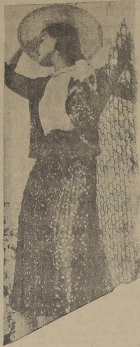
Vestido de "chiffón" azul con lunares blancos. Falda tabeada y blusa de "georgette" blanco, toda alforzada. Sombreros de paja rústica con cinta de "grosgrain"