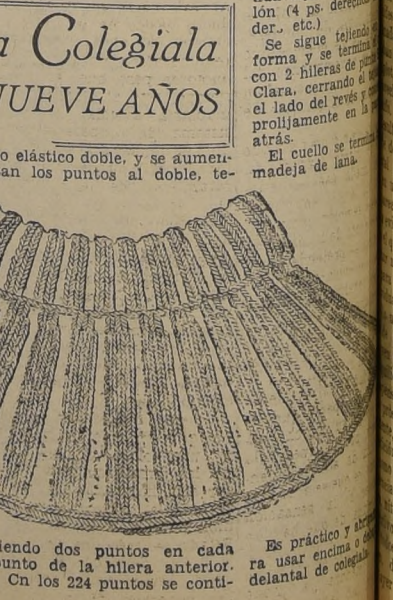
Es práctico y bonito para usar encima de un delantal de colegiala.

do para cualquier clase de muebles modestos. Una salita alargada, por lo general, tiene alguna esquina que se presta maravillosamente al uso de dos bancos forrados de cuero. La luz, que es un elemento importante en la colocación del juego de muebles, no debe olvidarse. El más conveniente y mejor tipo de iluminación es el indirecto, que puede ser prestado por una sola lámpara de pie, de las que proyectan la luz hacia el techo, o por pequeñas lámparas de pared. Tal vez, la lámpara de pie sea la más práctica; pues puede hacerse armonizar con el resto del mobiliario y es un bonito adorno en sí misma. PARA GUARDAR LOS UTENSILIOS DEL JUEGO. Un pequeño aparador o estante debe estar a la mano para guardar las cartas, tarjetas de anotación, lápices, contadores, y demás útiles