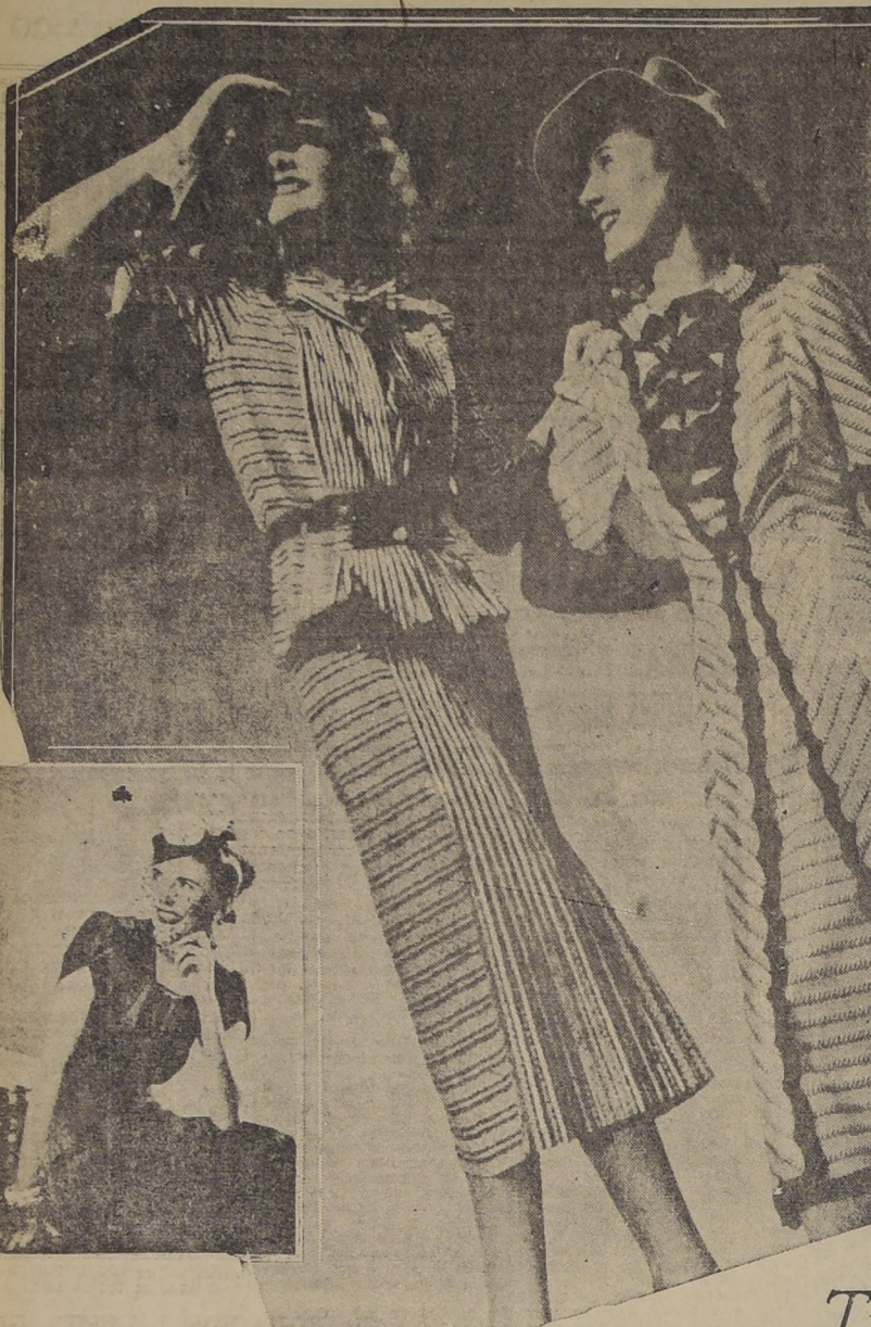
Traje de dos piezas, de cretona con cinturón de charol. Vestido y saco de fular. Modelo Paquin y fotografía Monneret, de París