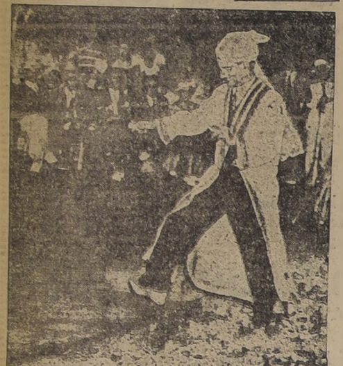
En la foto, el fakir de la India Ingles, es retratado en Nueva York en el momento de fumar uno de los cigarrillos que se encuentran en un andén de brasa de ocho metros de ancho...