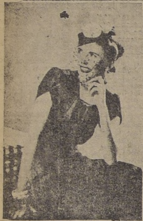
Vestido de "jersey" negro, inarrugable con panel fruncido en el delantero. Gorro de paja negra con dos clavetes blancos