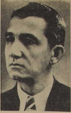
Excmo. señor León Cortés Castro, Presidente de la República de Costa Rica

Las Repúblicas de Guatemala, Nicaragua, Costa Rica, Honduras y Salvador celebran hoy ciento diecisiete años de vida republicana. Estrechos lazos de amistad nos ligan a nuestras hermanas del Norte, y por eso para los chilenos no puede pasar inadvertida la fecha que han consagrado a celebrar los acontecimientos que las colocaron en el alto plano de las naciones libres. El sentimiento de regocijo que los chilenos experimentan ante el acontecimiento centroamericano, tiene una sólida base de simpatía y comprensión, especialmente si se consideran las vinculaciones espirituales que nos unen a aquellas Repúblicas. Año a año llegan a nuestras instituciones docentes selectos grupos de estudiantes de Centro América, que vienen a recoger, unidos a los chilenos, el bagaje de conocimientos con que luego regresan a su patria para impulsar y proseguir la obra de progreso que diariamente se acelera. Y es así como muchas altas personalidades de nuestras hermanas norteamericanas, tanto en las actividades políticas como en las económicas y culturales, han guiado su espíritu de acuerdo con las prácticas de nuestras instituciones. Sus actividades están orientadas también en un sentido semejante, por cuya razón los sentimientos de amistad y