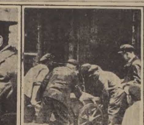
Empleados municipales de París entregan un cargamento de armas a un hotel, como medida de precaución contra los incendios derivados de posibles ataques aéreos.