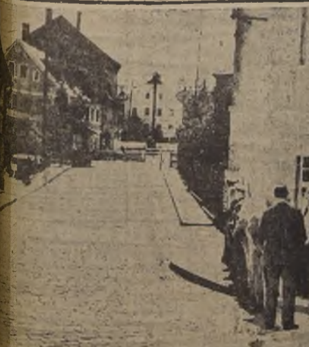
La casa aduanera alemana de Brno que, según la agencia D. N. B., fue atacada el 26 por elementos del puesto aduanero checoslovaco, al que se distingue al fondo de la calle.