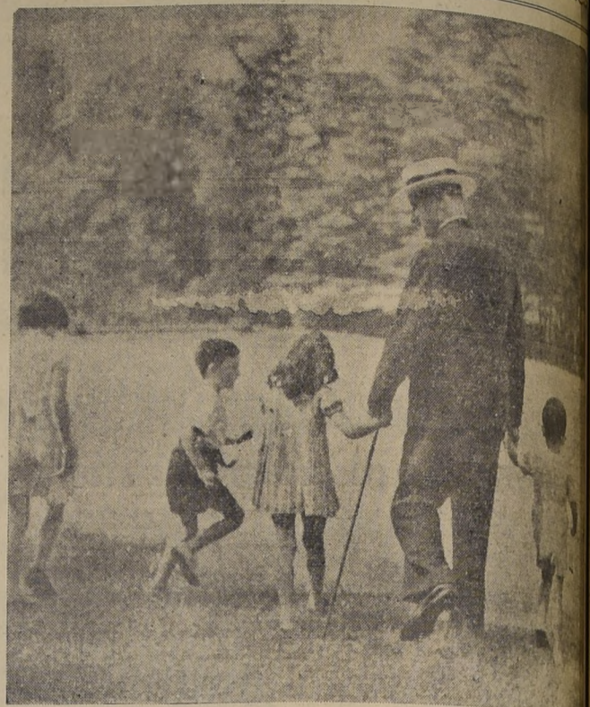
Mientras pasaba sus vacaciones fuera de París, el Presidente Lebrun abandonó la idea que un gran jefe de Estado requiere durante el desempeño de sus funciones...