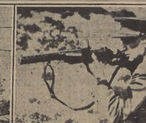
Un último modelo de ametralladora—que se dice es de fabricación alemana y procedente del Reich—hallado durante un allanamiento en la región sudeta.