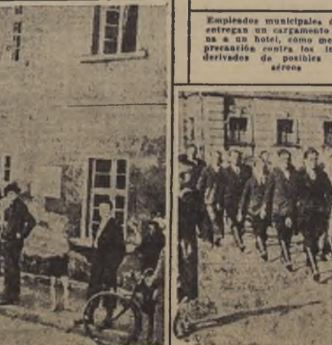
Los primeros voluntarios de los cuerpos francos sudetos, con su bandera al frente, marchan hacia sus posiciones sobre la frontera con Checoslovaquia.