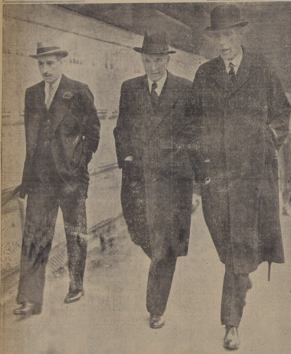
Sir Neville Henderson, Embajador británico en Berlín; Sir John Simon, Ministro de Hacienda y Lord Halifax, Ministro de Relaciones Exteriores...

ARTERIOESCLEROSIS, afecciones cardiacas (corazon), reumatismo, asma, gota, obesidad remedia sin provocar trastornos, el YODORGAN.