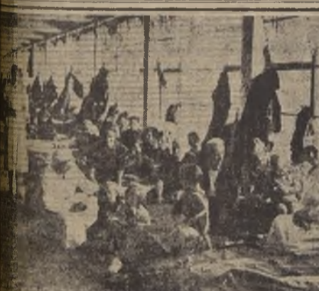
Los primeros checos que huyeron de la zona sudeta, atendidos en las instalaciones del Estadio Masaryk, en Praga, donde se les dió albergue.