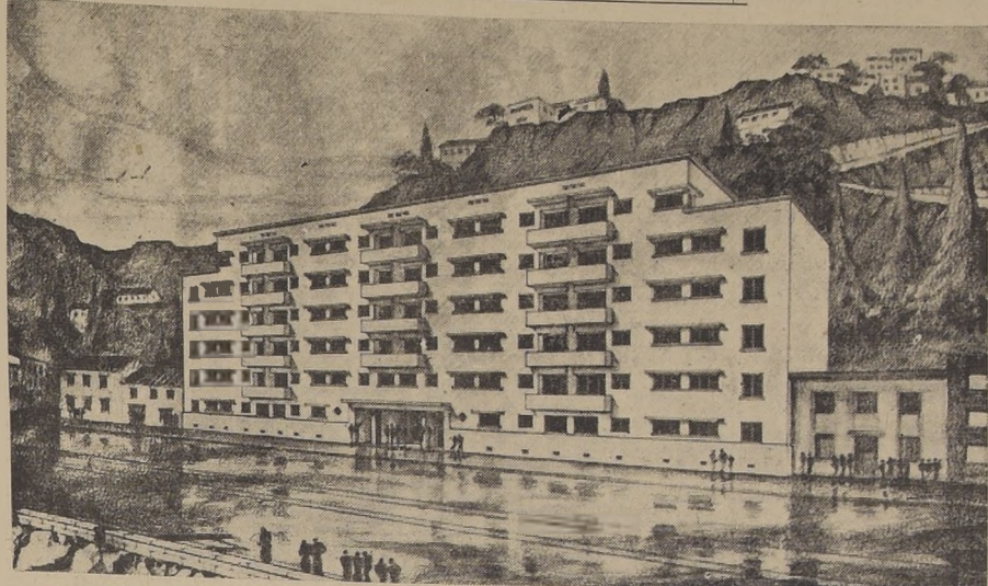
Edificio colectivo para obreros que construirá la Caja de Seguro en la Avenida España.

Se levantará en la Avenida España, cerca de la Casa de Reposo recientemente inaugurada. — Un nuevo aporte al mejoramiento de nuestra clase obrera y al hermo-seamiento de la ciudad. — Características de este edificio