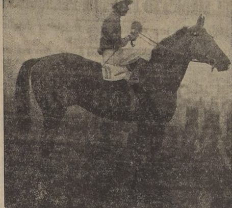
Sin duda alguna, a Trafalgar le cabrá la dura obligación de defender el prestigio de la guardia vieja en la brava milla clásica del domingo, contra potrillos de la talla de Furgon, Santidad y De Bono