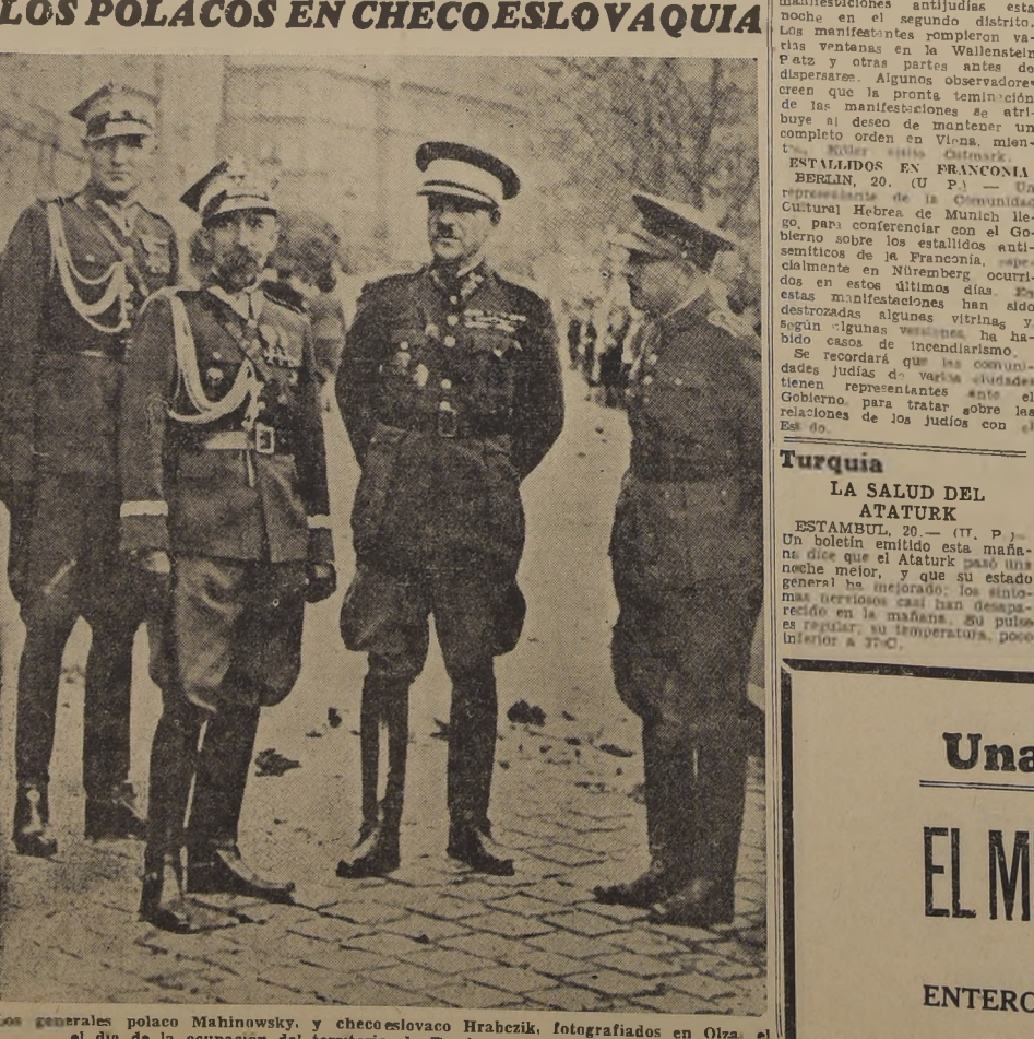
Los generales polaco Mahinowsky, y checoslovaco Hrabczik, fotografiados en Olza, el día de la ocupación del territorio de Teschen por las fuerzas polacas