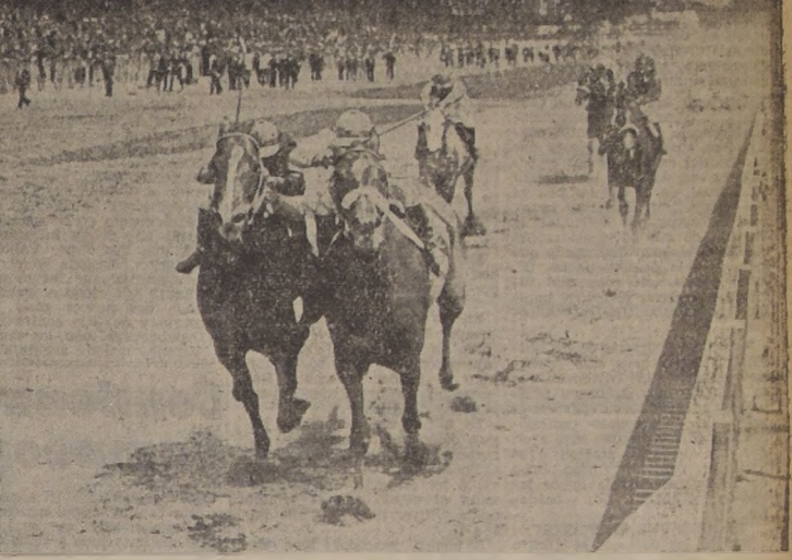
Atlántida da cuenta de Ismir y Blue Girl en el handicap de fondo

SEPTIMA CARRERA Nuestro favorito Tintoretto, que atravesó por un periodo extraordinario, alcanzó su cuarta victoria en la temporada, al dar cuenta de Mississippi, en la serie principal de velocidad. El pique vino rápidamente y Tintoretto surgió a la vanguar-