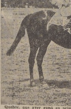
Quebec, que ayer ganó su primera carrera. Jockey: P. Flores

BEE SE IMPUSO EN MUY BUEN ESTILO El programa siguió su desarrollo con la última serie de los 1.500 metros, handicap, para todo ganador de más de quince mil pesos, de la cual se eliminaron Maribú, Ya Voy y Hero, que venía de fracasar rotundamente el domingo. En punta surgió Pochollita, pues iba favorecida con los pesos, pero luego violentó Bee, quedando a continuación Levantisco, Pochollita, Campanil y Montarguís, con muy escasa diferencia, delante de El Aja, Lonocaprio y Pif Paf, cerrando el paso, lejos del conjunto y ziguendo su estilo, el favorito Voltador.