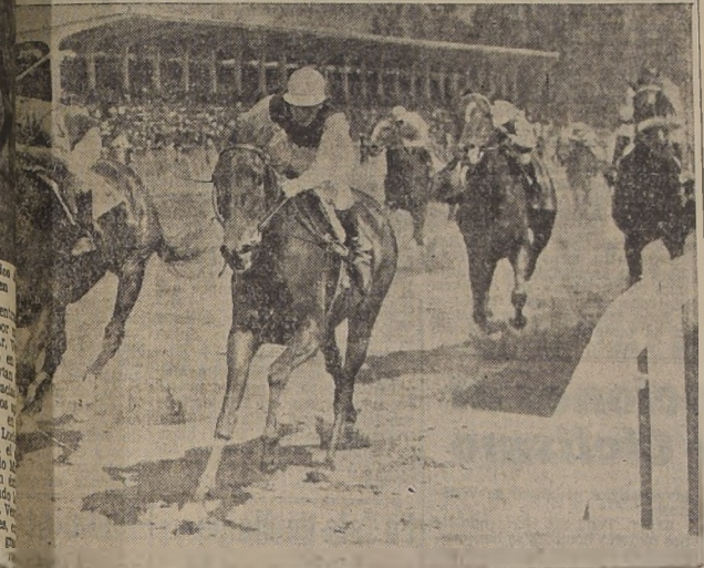
Farrutita delante de Metina y Pampero

LA HIJA DE URBION, EN RENIDO FINAL, BATIÓ POR MEDIA CABEZA AL FAVORITO ISMIR, QUEDANDO TERCERA BLUE GIRL, A DOS LARGOS.— VOLHYNIA (MILIMETRO) Y ERITREA (MAIDSTONE) ABANDONARON LA CATEGORÍA DE PERDEDORES, REPARTIENDO LA PRIMERA DE ELLAS EL MEJOR DIVIDENDO DE LA REUNIÓN: $ 184.00 POR UNIDAD DE CINCO.— EN LAS SERIES DE VELOCIDAD TRIUNFARON FOR YOU, FARRUTITA, INSTANTANEA, TINTORETTO Y KOBI