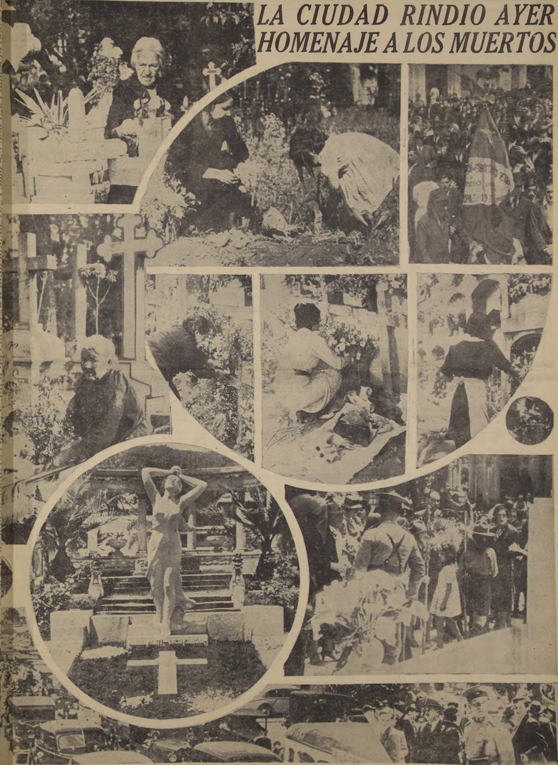
De los muertos todos los hombres se igualan. Así ayer, en los cementerios de Santiago, hombres de todas las condiciones sociales se juntaron para rendir a los que se fueron el recuerdo convertido en flores y en plegarias. Nadie dejó de formar en la tradicional romería a los cementerios. Las fotografías que ofrecemos, constituyen un documento gráfico de la forma cómo la ciudad se inclinó ayer ante la memoria de sus muertos