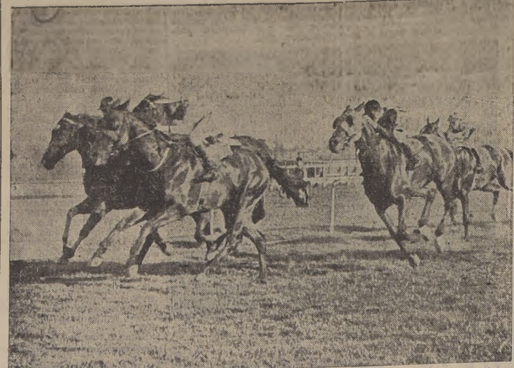
En reñido final, Mojicón bate estrechamente al gran favorito Yelmo II y a Soledad en el clásico Agustín R. Edwards