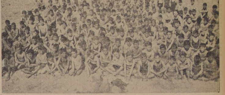
Un grupo de los miles de niños que la Junta de Beneficencia Escolar lleva anualmente a las playas

En todo el país se solicitará la ayuda del público para esta obra de salvación de la raza