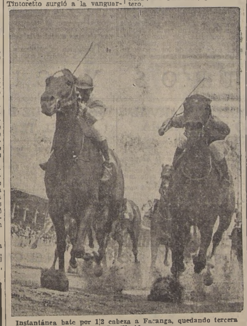
Instantánea bate por 1/2 cabeza a Faranga, quedando tercera La Florida

PRIMERA CARRERA En la reunión del premio Pastel, se disputó una carrera de 1,200 metros, en la que se enfrentaron a tres años no cumplidos, la hija de Urbion, la outsider, Ismir, que se clasificó en primer lugar, con un tiempo de 1:24 y 18.4 segundos. En la categoría de favoritos, Ismir remataron en la categoría de perdedores, clasificándose en último lugar. Benedictine terminó en el tercer lugar, con un tiempo de 1:20 y 55.90 segundos.