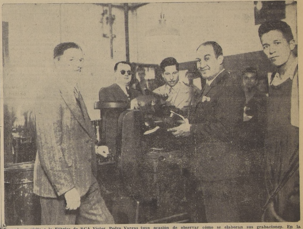
Durante su visita a la Fábrica de RCA Victor, Pedro Vargas tuvo ocasión de observar cómo se elaboran sus grabaciones. En la Fotografía aparece el popular cantante en la Sección Prensas de Discos, teniendo en sus manos una "Noche de Ronda" recién fabricada.

Como una nota de alta atracción informativa, publicamos algunas fotografías de la visita que hizo el famoso cantante mexicano Pedro Vargas a la Fábrica de R. C. A. Victor Chilena, ubicada en la Avenida Vicuña Mackenna, y en donde se elaboran los discos que llevan el sello de esta acreditada marca.