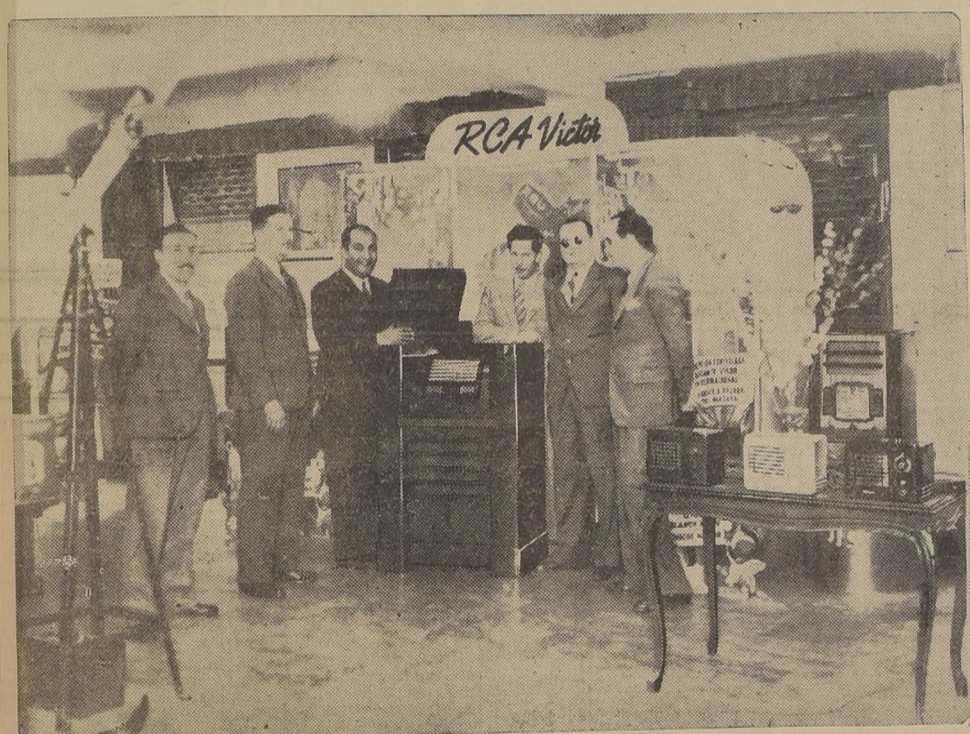
Pedro Vargas escucha su propia voz. Durante su visita a la Exposición General de Radios RCA Victor, en el Sector Comercial del nuevo edificio 'Banco de Chile', el popular tenor mexicano tuvo la satisfacción de escuchar sus canciones más conocidas, grabadas en Discos Victor.