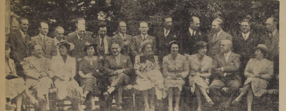
Parte de los asistentes al almuerzo ofrecido en la Florida a los delegados al Congreso de Aseguradores

LA REUNION DE HOY SE EFECTUARA A LAS 11 HORAS