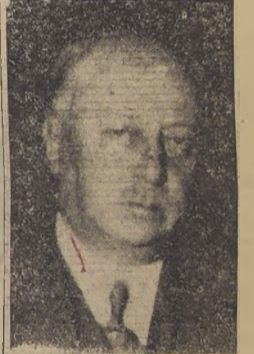
Ministro de Hacienda, señor Francisco Garcés Gana

Dice el Ministro de Hacienda señor Garcés Gana