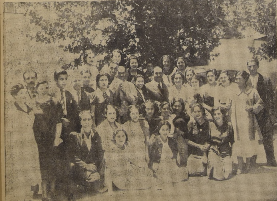
La popularidad de Pedro Vargas quedó de manifiesto durante su visita a la Fábrica de RCA Victor. En la foto aparece rodeado por parte del personal femenino que estaba dedicada a elaborar sus grabaciones en Discos Victor.

tor Chilena, que interviene en la elaboración de los discos con los cuales se deleitan los públicos de toda la América. Durante su visita a las diferentes secciones de la Fábrica, el aplaudido cantante recibió múltiples manifestaciones de simpatía del personal, especialmente del elemento femenino, el cual se manifestó entusiasmado ante la