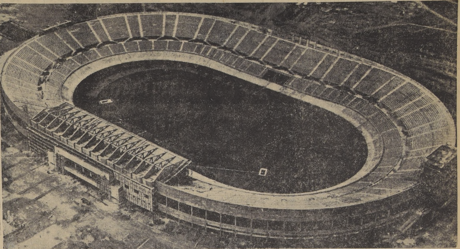
Vista panorámica del gran anfiteatro del Estadio Nacional que se inaugura hoy, donde puede apreciarse el conjunto de graderías de hormigón armado, con 52 mil asientos de madera, la cancha de football y las pistas de atletismo y ciclismo

LAS PUERTAS DEL ESTADIO SE ABRIRAN A LAS 13 HORAS