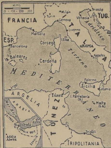
En el mapa adjunto pueden verse la isla de Córcega y la Regencia de Túnez, territorios franceses que, juntamente con el puerto de Jibuti, en el Somalí Francés, que puede verse en el cuadro aparte, parecen ser objeto de las reivindicaciones italianas manifestadas con motivo del discurso del Conde Ciano ante la Cámara de Diputados.

ESTA ULTIMA "ESTA PRONTA PARA MOVILIZARSE CONTRA FRANCIA, SI ES NECESARIO", DICE EL FASCISTA VIRGINIO GAYDA EN SU DIARIO