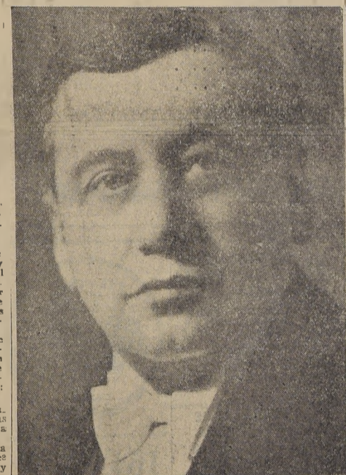
S. E. el Presidente de la República, Excmo. señor Arturo Alessandri Palma, que estimuló todos los esfuerzos para obtener la más pronta terminación de las obras del Estadio Nacional, recibirá hoy el homenaje del deporte chileno en uno de los más importantes actos de su Administración.

Y finalmente, no nos equivocamos al pensar que este gran público chileno, que ha sabido siempre dictar cátedra de valentía, esta vez va a mantener inalterable su línea, para hacer que en el acto inaugural, no haya de ser, sino esta comprensión que complementará la magnitud del acontecimiento que hoy hace vibrar a todo el país.