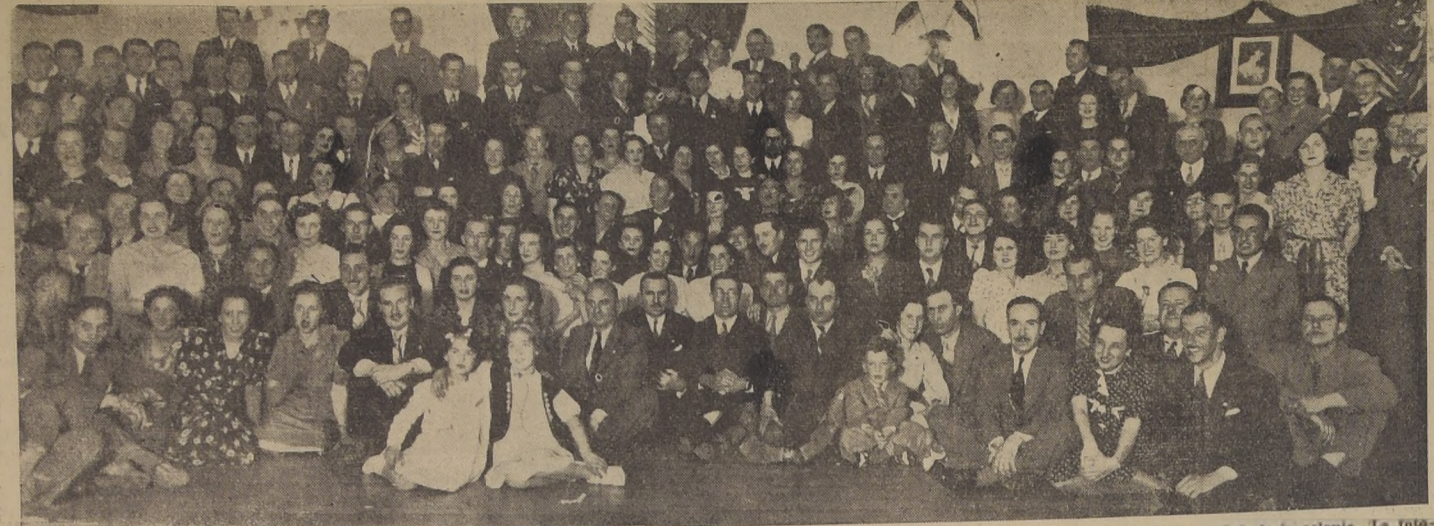
Las festividades en celebración del aniversario patria de Yugoslavia culminaron en la noche del jueves con una fiesta seguida de baile, habida en el Club de la colonia. La fotografía muestra a los miembros de la colectividad yugoslava de Santiago asistentes a ese baile.