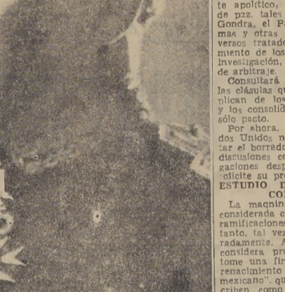
Excmo. señor Oscar Benavides, Presidente de la República del Perú