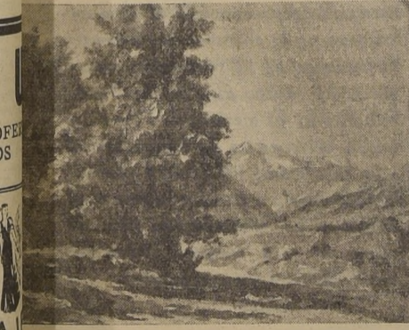
Rincón del Maipo, paisaje de Guillermo Kaulen

Mañana a las 19 horas, se inaugurará en la sala del Banco de Chile, la Exposición de cuadros del conocido pintor y arquitecto Guillermo Kaulen. En esta ocasión, Kaulen presenta un conjunto de 50 telas, ajenas chilenas en su enorme variedad, que confirman las cualidades que la crítica señaló en el artista, a raíz de su primera Exposición, efectuada el año pasado. Las Condes, El Canelo