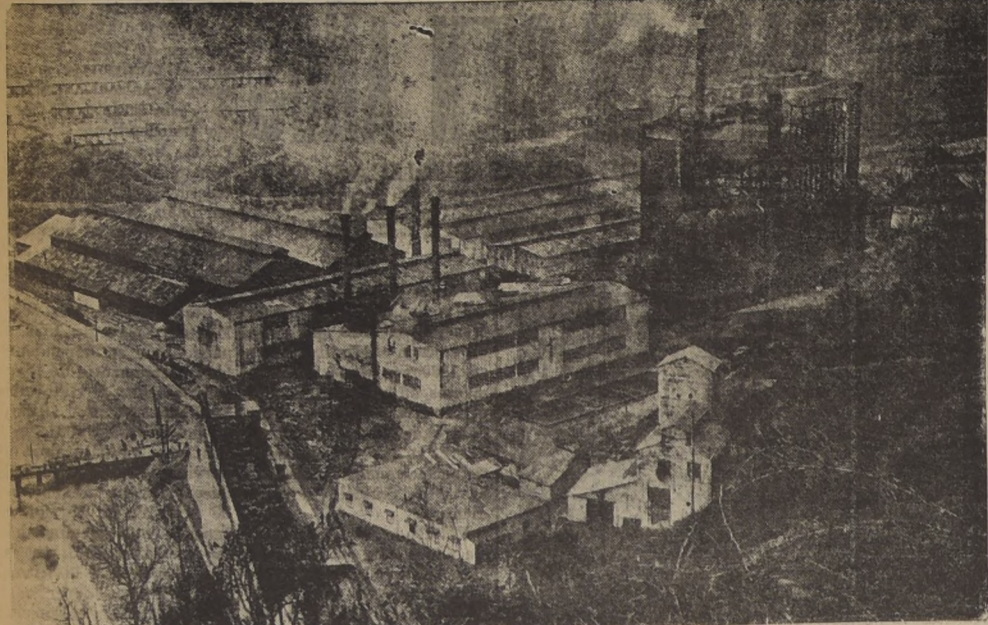
LAS USINAS DE CORRAL DE LA CIA. ELECTRO-SIDERURGICA E INDUSTRIAL DE VALDIVIA

Lo que significa para el país la Cia. Electro-Siderúrgica e Industrial de Valdivia