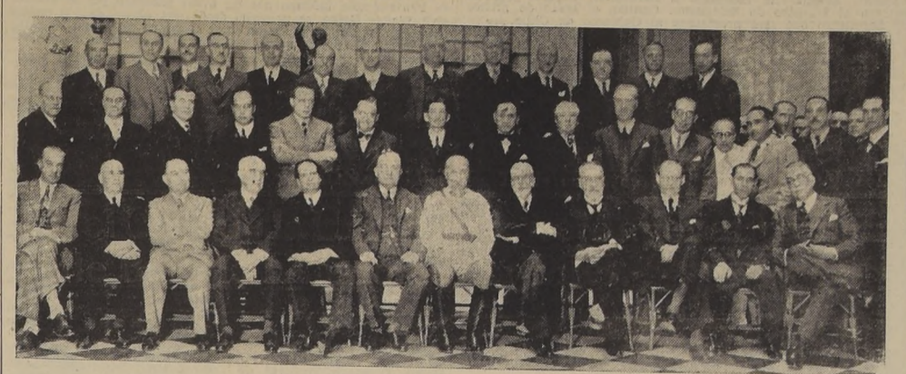
Asistentes al almuerzo de ayer al Excmo. señor Siles