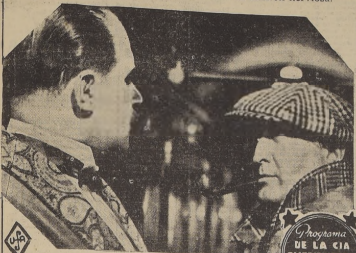
ADMIRE UD. AL NOTABLE ACTOR ALEMAN

Siga usted las incidencias, las aventuras y las sorpresas de una obra que lo mantendrá en constante tensión nerviosa.