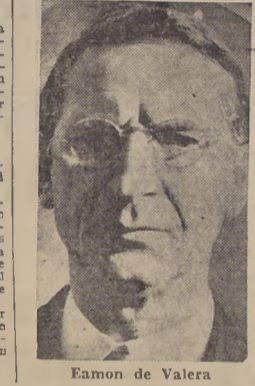
Eamon de Valera