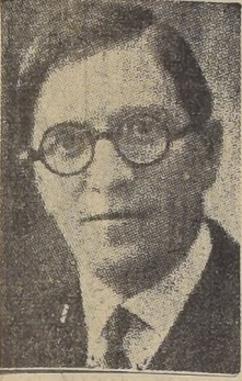
Julio Alvarez del Vayo

Su respuesta a las peticiones de Alvarez del Vayo en este sentido fue el envío de 4 pelotones de guardias móviles a reforzar la v.igilancia del límite.—El Canciller español no logró conmovier a los gobernantes franceses con su dramático cuadro de la situación republicana