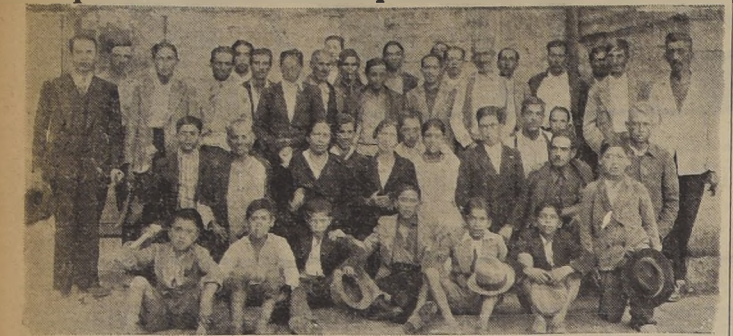
Grupo de campesinos de la Chacra "Santa Corina", de Barrancas, que han sido despedidos por sus peticiones.