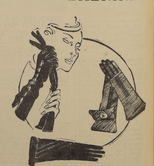
Estos modelos son adecuados para las noches. Tenemos primero los de gamuza negra, abiertos en el dorso y respuntados con blanco. Debajo presentamos unos guantes cortos, en tono verde vivo, respuntados y bordados con seda color herrumbre. Arriba, a la derecha, unos guantes para deportes, de gamuza malaga, con puño doble. El de la izquierda lleva un pequeño espejo, como detalle de coquetería.