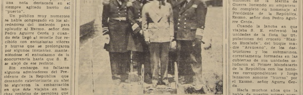
El Presidente de la República en el submarino "Thompson"