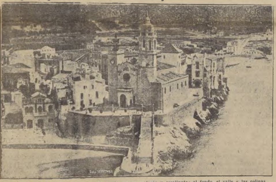
Una vista de Sitges. En primer término la iglesia con su malecón y escalinata; al fondo, el valle y las colinas