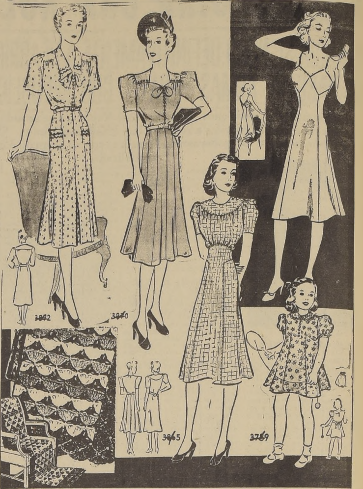
Cinco modelos de la moda para la presente estación

Es perjudicial enseñarle lectura, escritura o aritmética antes de matricularlo en la escuela. Cuando ingresa a ella no se interesa por las clases; se pone desatento y sigue así aún cuando estén tratando materias nuevas para él. Con más provecho se emplea este tiempo en el aprendizaje de trabajos manuales sencillos, de cantos y juegos colectivos, de los principios elementales de la música algo áridos, y por tanto, más tolerables en época temprana. Su cultivo debe estar restringido a los niños de talento para este arte y no impuesto contra todo deseo y toda lógica.