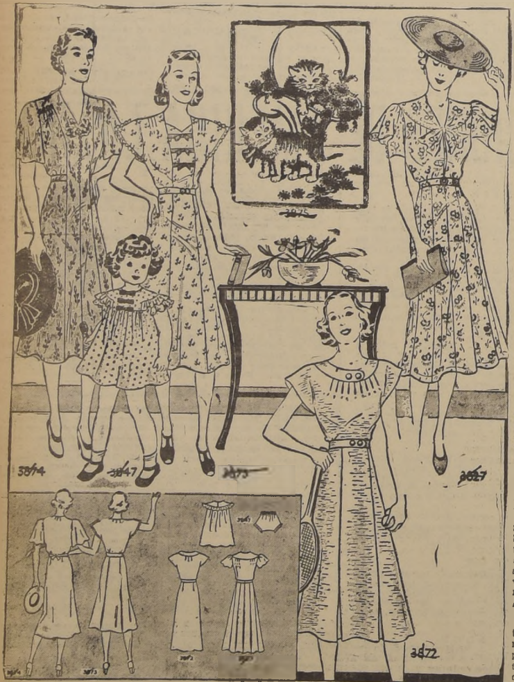
Cuatro modelos de verano para la casa, el deporte o el paseo. Además un modelo para niña