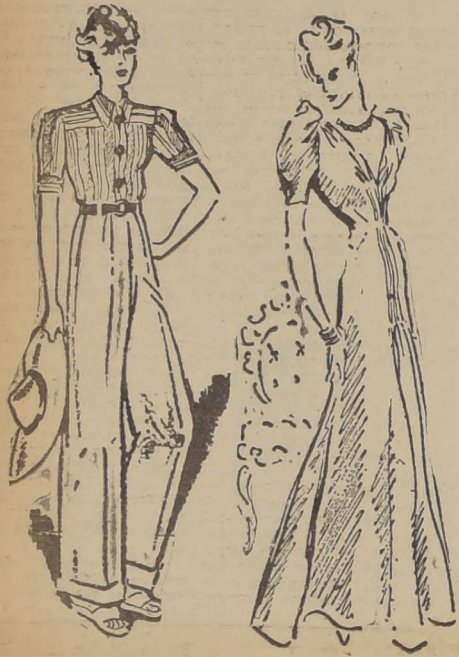
Pantalón de tela blanca muy deportiva que completará una blusa rayada de tonos pastel, cerrada con botones oscuros; además, un cinturón del mismo tono.