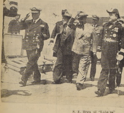
S. E. llega al "Latorre"