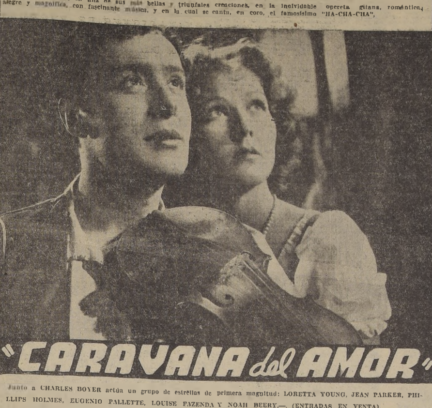
¡Junto a CHARLES BOYER actúa un grupo de estrellas de primera magnitud: LORETTA YOUNG, JEAN PARKER, PHILLIPS HOLMES, EUGENIO PALLETTE, LOUISE FAZENDA Y NOAH BERRY.— (ENTRADAS EN VENTA).

"EL CONDE LUXEMBURGO", EN LA TARDE, Y ESTRENO DE "MARINA", EN LA NOCHE, HOY EN EL COMEDIA