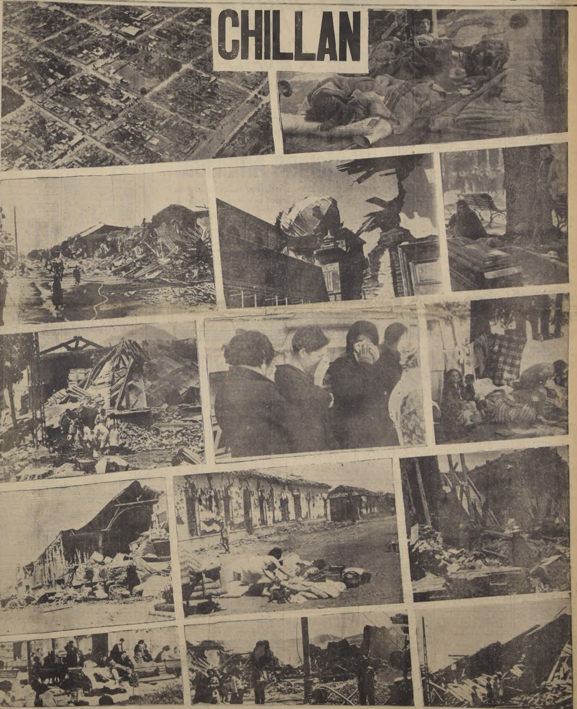
Estos gráficos dan una idea de la horrenda catástrofe que dejó estropeada en un breves espacio de tiempo a la ciudad de Chillán

GRAFICOS DE CONCEPCION EN PAG. 20 Y DETALLES EN PAGS. 9 - 10 - 11 - 12 Y 13