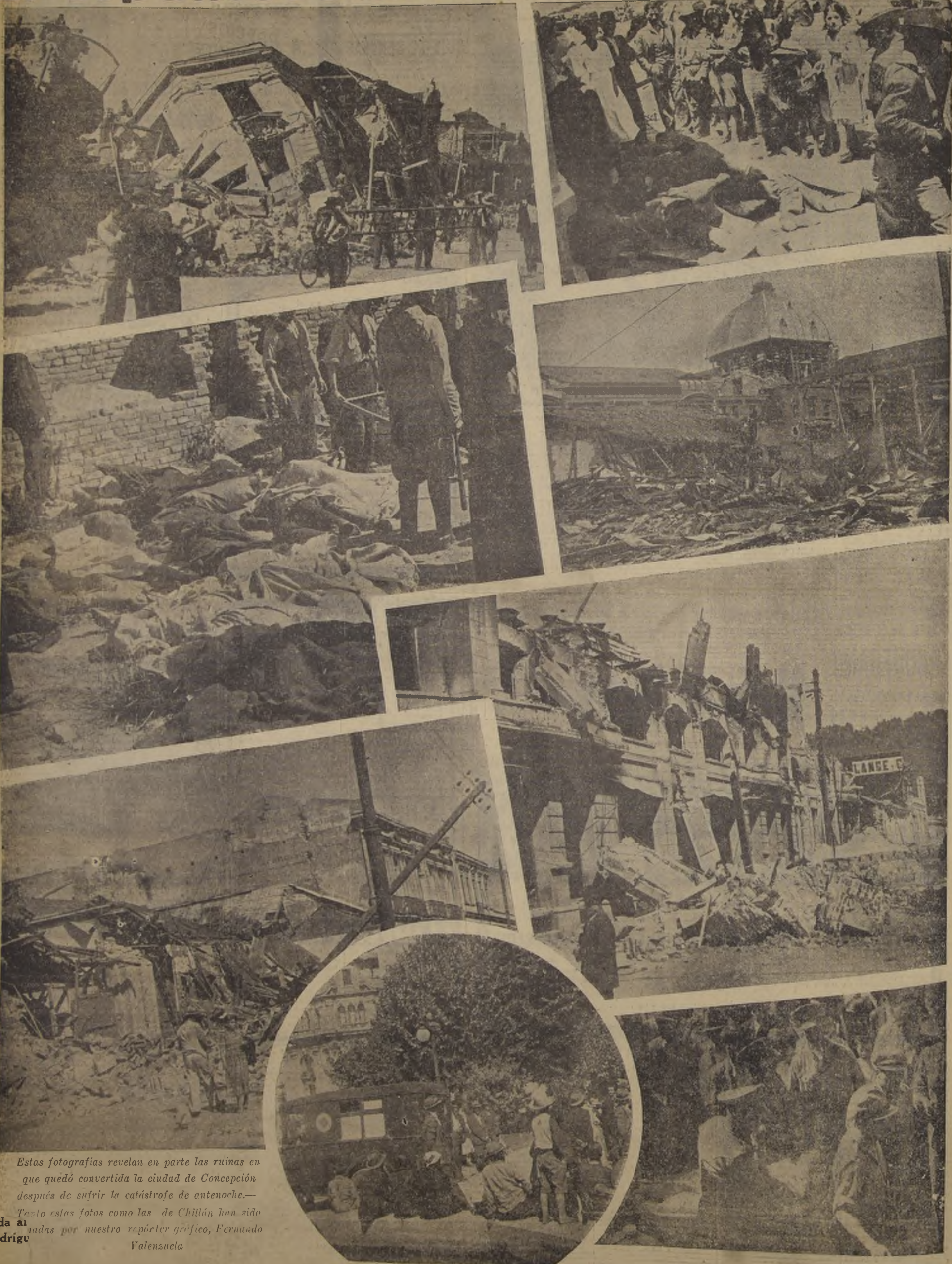
Estas fotografías revelan en parte las ruinas en que quedó convertida la ciudad de Concepción después de sufrir la catástrofe de antenoche.—

Tanto estas fotos como las de Chillán han sido dadas al mundo por nuestro repórter gráfico, Fernando Valenzuela