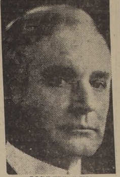
CORDEHL HULL Presidente de la Unión Panamericana, que cooperará a la ayuda

Toda clase de instituciones, oficiales y particulares, en todo el territorio argentino presta su cooperación.— Una comisión nombrada por Getulio Vargas coordinará la ayuda de la nación brasileña.— Cinco aviones militares y un vapor brasileño partirán en breve a Chile.— Un llamado de Mr. Roosevelt al pueblo norteamericano.— Cada vez encuentra más ambiente el proyecto del diputado Fish sobre el millón de dólares