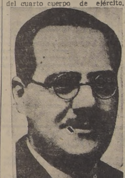
PREMIER NEGRIN Habló ayer en Consejo de Ministros habilitado en Figueras

que fue el que más contribuyó a la derrota de los italianos en Guadalajara, en marzo de 1937.