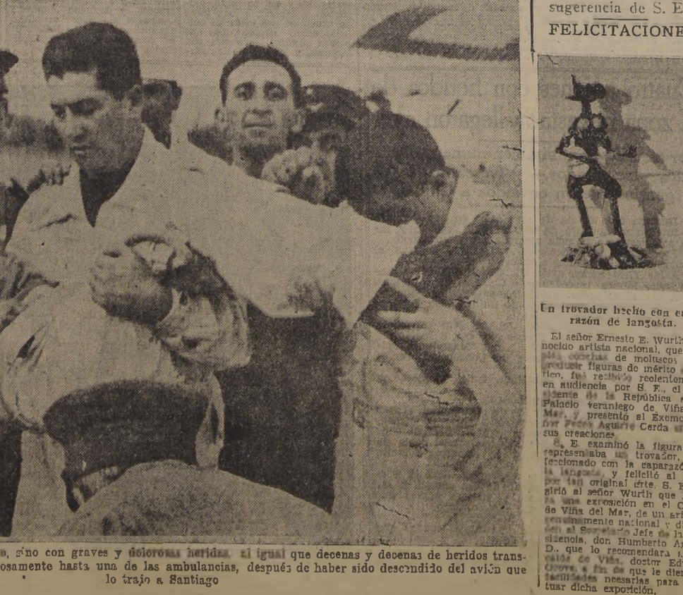
Un muchacho del pueblo, que salvó con vida, mas no ileso, sino con graves y dolorosas heridas, al igual que decenas y decenas de heridos transportados por los ayones a la capital, es llevado cuidadosamente hasta una de las ambulancias, después de haber sido descendido del avión que lo trajo a Santiago