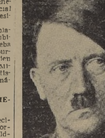
CANCELLER A. HITLER Su discurso en el Reichstag determinó las declaraciones del Primer Mandatario de E. E. UU.

MONTEVIDEO, 1.º (U. P.). — En el Palacio del Poder Legislativo se iniciaron mañana las deliberaciones de la Comisión regional tercera de meteorología, con la asistencia de Argentina, Uruguay, Brasil, Perú, Colombia, Venezuela, Inglaterra, Alemania, Italia y Estados Unidos y de las Compañías Panamericanas, Airways y Air France.