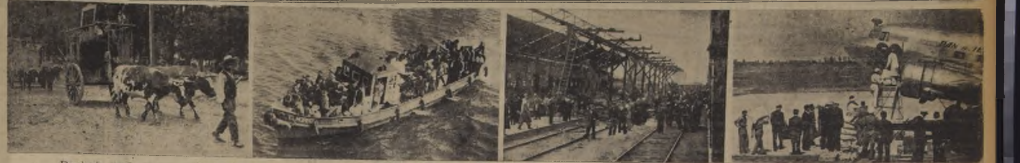
Desde la modesta carreta hasta el avión, han empleado las autoridades para la evacuación de los heridos y damnificados de las ciudades asoladas por el terremoto