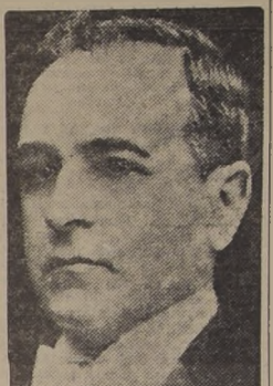
GETULIO VARGAS Nombró una Comisión de Coordinación por ayuda a los damnificados

La resolución comprende instrucciones en el sentido de que copias de la misma sean enviadas inmediatamente a todas las entidades de Cruz Roja y organizaciones similares de todo el Hemisferio.