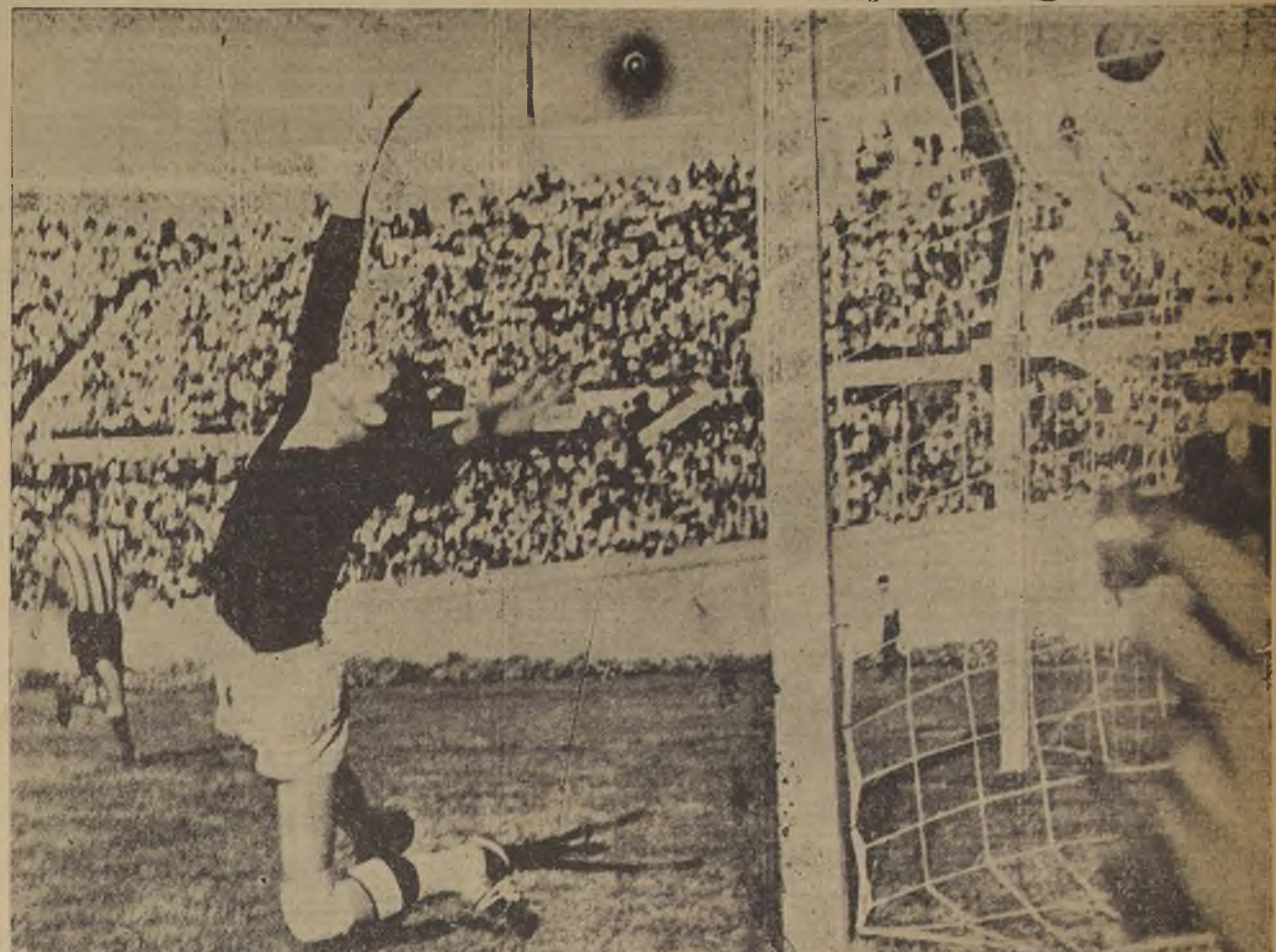
El primer goal de los paraguayos. No obstante su esfuerzo, Lobos no puede impedir que la pelota, enviada por Barreiro, llegue a las redes. Los extranjeros reaccionaron notablemente en la etapa final; pero no pudieron descontar la ventaja de los chilenos

Previos los trámites de rigor, los capitanes sortearon el lado que favoreció al del equipo nacional. Protagonistas: Arbitro: M. Soto; linesman: