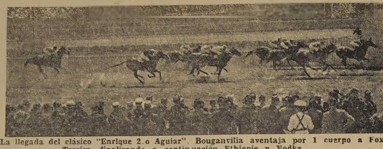
La llegada del clásico "Enrique 2.o Aguiar" Bouganvilla aventaja por 1 cuerpo a Fox Terrier, finalizando a continuación Ethiopie y Vodka