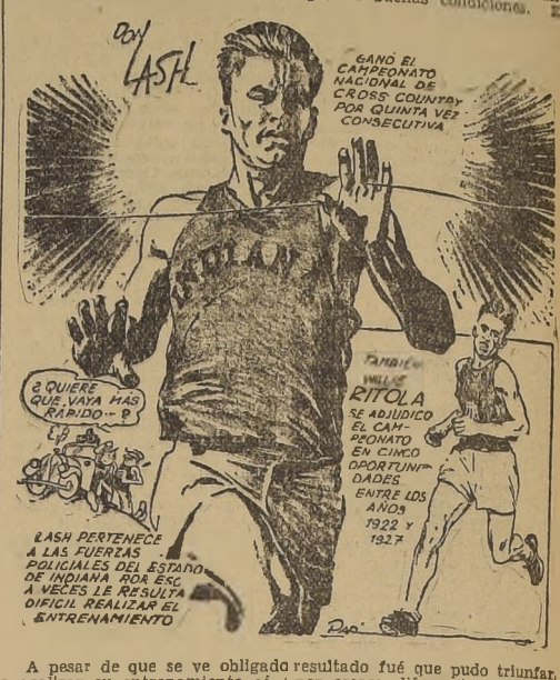
GANO EL CAMPEONATO NACIONAL DE CROSS COUNTRY POR QUINTA VEZ CONSECUTIVA