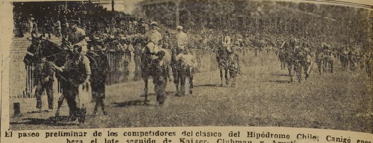
El pase preliminar de los competidores del clásico del Hipódromo Chile, Canigo encabeza el lote