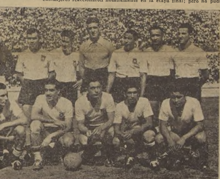
El seleccionado paraguayo que ayer cumplió su propósito ante Chile. Su triunfo de 2 a 4 fué un fiel reflejo de los méritos de cada uno