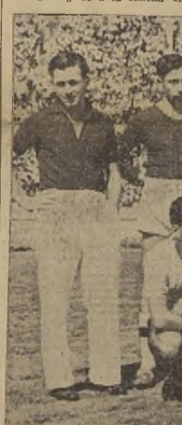
El seleccionado nacional que ayer cumplió su propósito ante el Paraguay. Su triunfo de 4 a 2 fué un fiel reflejo de los méritos de cada uno

Eran las 15.45 horas, cuando hizo su ingreso a la cancha el