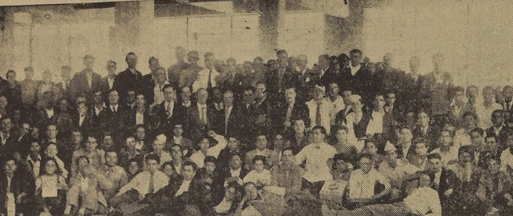
Parte de la concurrencia al almuerzo ofrecido por los jefes de la firma RCA Victor...

TOSAS REBELDES catarras, resfriados, asma, lo más seguro es dominar el específico SOLVINA.