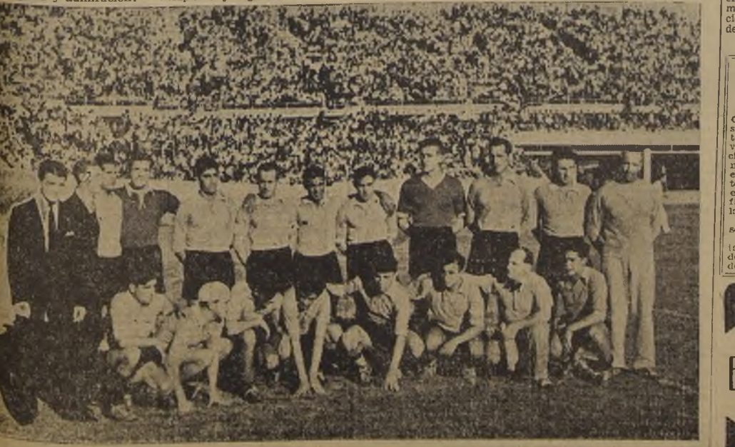
Seleccionado uruguayo que brindó una excelente demostración de su capacidad técnica, goleando al combinado profesional por 8 a 1.