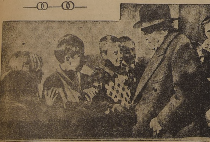
Albert Sarraut, Ministro francés del Interior, conversando con algunos de los niños españoles durante su viaje reciente a Le Perthus, en la frontera española