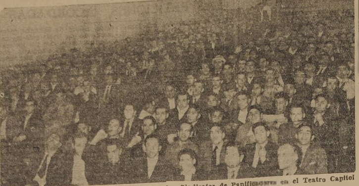
Durante la concentración celebrada ayer por los Sindicatos de Panificadores en el Teatro Capitol

DIRECCION DE APROVISIONAMIENTO DEL ESTADO. Solicítanse propuestas públicas por los siguientes artículos de fabricación nacional y extranjera: