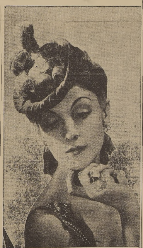
Preciosa toca y peinado que constituyen la nota de moda actual en París y que lucirán nuestras damas elegantes durante la temporada de otoño.