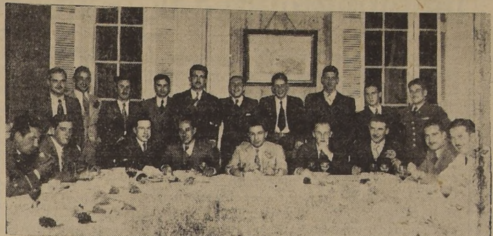
Asistentes a la manifestación de despedida a los nuevos pilotos de guerra egresados de la Escuela de Aviación.

Antenoche se efectuó en el Club Militar la manifestación con que sus compañeros de armas despidieron a los nuevos pilotos de guerra recientemente egresados de la Escuela de Aviación, con motivo de su destinación a las diversas bases aéreas del país.