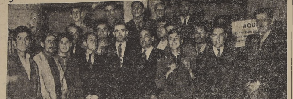
Miembros del Sindicato Profesional de Choferes y Cobradores de Autobus de la línea San Eugenio, de esta capital, que anoche visitaron "LA NACION", momentos después de constituirse este organismo.