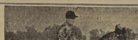
Boulogne, calificado como un stayer de calidad, al imponerse en el domingo en el clásico "José Luis Walker", prueba en la que estará colizado favorito.