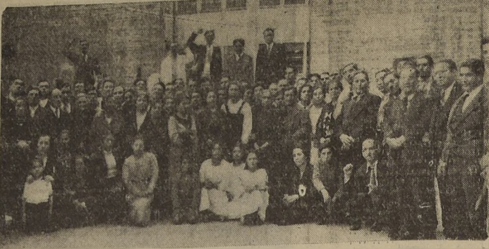
Miembros del Gremio de Comerciantes Minoristas de los Sindicatos Vega-Matadero que participaron en la asamblea de ayer.

En asamblea de ayer ratificaron su sentir sobre el Depto. de Subsistencias y el funcionamiento de las Ferias Libres