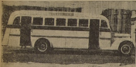
Uno de los nuevos autobuses que inician hoy el recorrido de la línea Vega Poniente.—Pasaje popular de $ 0.20.