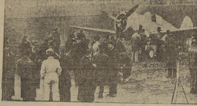
Uno de los 600 aviones comprados por Francia a EE. UU. es inspeccionado en un aeródromo militar de París. Se trata de un Curtiss monoplane de caza, que en línea horizontal desarrolla más de 600 K.P.H.