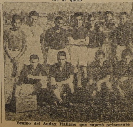
Equipo del Audax Italiano que superó netamente al de los españoles