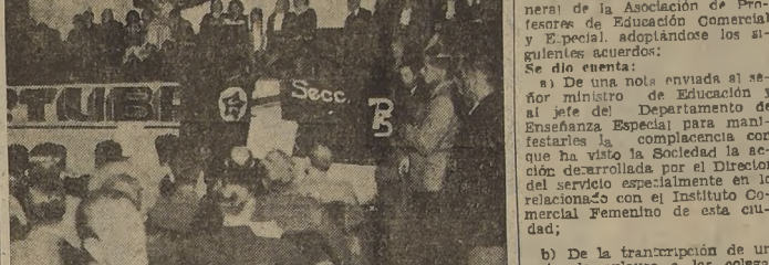
Mesa directiva del homenaje a la señora de Schnake en el Teatro Monumental