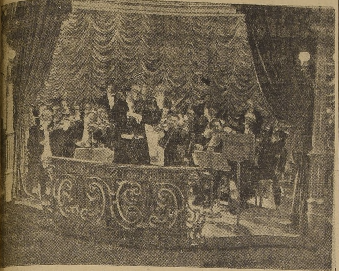
El Gran Vals en el rol de Johann Strauss, dirige su primer vals con la orquesta de la vienesa, en una de las escenas de esta maravillosa película que revivirá toda una época de romance y de alegría.

En todas las grandes ciudades del mundo se han organizado competencias entre los aficionados a esta vieja y aristocrática danza. El Teatro Metro, "LA NACION" y el "Lucerna" ofrecerán esta misma oportunidad para los que gustan del vals, durante cinco noches vienesas, que se efectuarán en el Salón del "Lucerna", del 1.º al 5 de abril próximo.