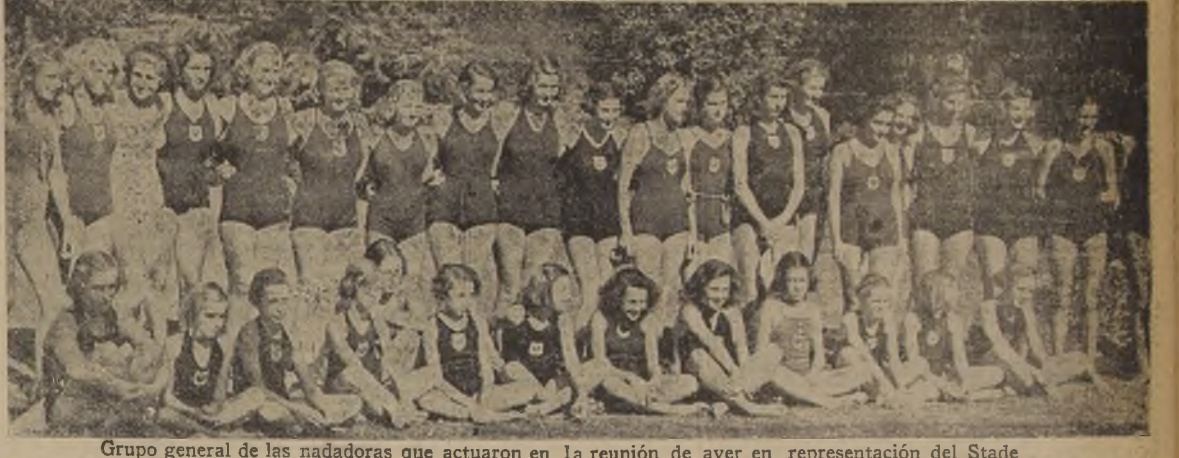
Grupo general de las nadadoras que actuaron en la reunión de ayer en representación del Stade Francais.