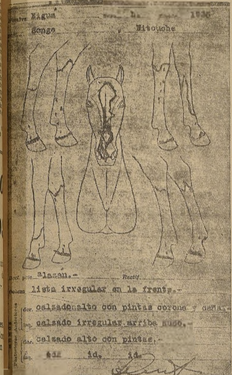
Lista irregular en la frente. Saldado alto con pintas. Saldado alto con pintas.

PARA CADA PRODUCTO SE HACE UNA CÉDULA DE IDENTIDAD GRAFICA EN FORMA PROLJA Y MUY DETALLADA. UNORME IMPORTANCIA TIENE EL TRABAJO DIFUSO Y COMPLICADO QUE REALIZA EL STUD BOOK EN LA HIPICA