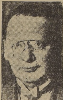
El Comisario de Relaciones Litvinoff, de cuyo Gobierno se solicita ahora la adhesión al bloque antifascista.

LAS NEGOCIACIONES COMENZARON PARALELAMENTE EN LONDRES Y MOSCÚ. — EL FOREIGN OFFICE CONTEMPLA, COMO PASO INICIAL, UN ACUERDO SEGUN EL CUAL URSS PROPORCIONARIA ARMAS Y OTROS MATERIALES A LOS ESTADOS AMENAZADOS O ATACADOS POR LOS DICTADORES. — FRANCIA ESTA TOMANDO TAMBIEN PARTE ACTIVA, Y OTRO TANTO HACER ANTE YUGOSLAVIA. — PERO QUEDA SIEMPRE EN PIE LA DIFICULTAD DE RUMANIA Y POLONIA. — ESTOS DOS PAISES SIENTEN INVENCIBLE REPUGNANCIA A PACTAR CON RUSIA