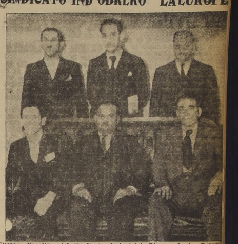
Cuerpo directivo del Sindicato Industrial Obrero de la Fábrica La Europea que actualmente impulsa importantes aspiraciones dentro de la industria pastelera y sus ramos similares.