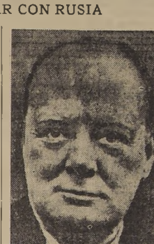
Winston Churchill, diputado y ex Ministro británico conservador, que quiere la amistad de Rusia.

EL PAPEL QUE JUGARA URSS Bonnet, en conversaciones diplomáticas sostenidas hoy con los Embajadores ruso, polaco y rumano, trató principalmente del papel que desempeñaría Rusia en el bloque defensivo. Rusia no hace ningún esfuerzo para cubrir su frontera con Polonia en alguna de las zonas que se le han ofrecido en forma de hacerla extensiva a los países escandinavos y turcos, y su nuevo Gobierno lo permite a Yugoslavia que se ve entre dictadores, Italia, Alemania, Hun-