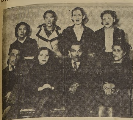
El activo directorio del Sindicato Profesional de Tejedores, or-