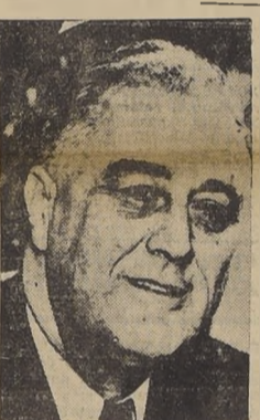
Mr. Roberto Wachholtz, Ministro de Hacienda de Chile, en su visita a Washington.

WASHINGTON, 5 (U. P.) — En fuentes oficiales se manifestó a la U. P. que el Ministro de Hacienda de Chile, don Roberto Wachholtz, "no tendrá ninguna dificultad" en obtener un crédito por intermedio del Banco de Exportación e Importación.