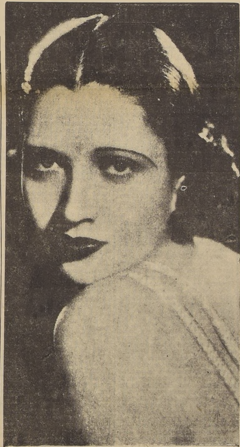
Kay Francis, representa un tipo de mujer que tiene muchos admiradores entre los aficionados al cine. ¿Predominará este tipo en la elección que se hará en los Teatros Real y Baquedano? Pronto lo sabremos.

El Concurso Nacional de Belleza está contribuyendo al desarrollo de una intensa actividad comercial, debido a la demanda de cupones que hace el público. A este respecto el beneficio es mutuo para el comercio y el público. El primero verá incrementada sus ventas, debido al interés de los votantes por sufragar por sus candidatas a Reina, y el segundo está comprendiendo los positivos beneficios que logrará en el Concurso de Belleza. No hay que olvidar, por otra parte, que esta apasionante encuesta tiene estímulo de gran valor que serán entregados a los votantes en el escrutinio final. Tampoco por este capítulo el público tendrá gasto alguno, ya que el cupón que guardará en su poder, al efectuar cada compra, entrará a participar en la distribución final de premios, cuyo monto ascenderá a cerca de un millón de pesos.