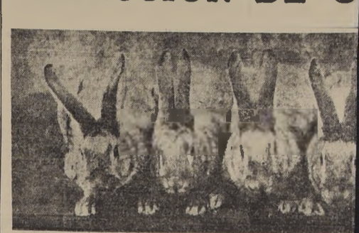
Los más bellos, llenos de vitalidad