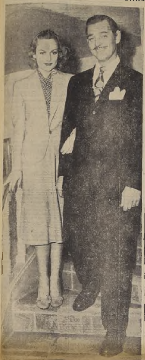
Recién casados (hace apenas unos días), aparecen en su hogar los actores Clark Gable y Carole Lombard.