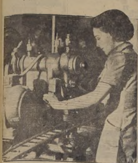
Hace 20 años, durante la guerra europea, las mujeres reemplazaron a los hombres en las fábricas de municiones y armamentos, para que aquellos fueran al frente. Hoy, aunque no hay guerra, ya las mujeres en Gran Bretaña están ocupadas por centenares en dichas fábricas