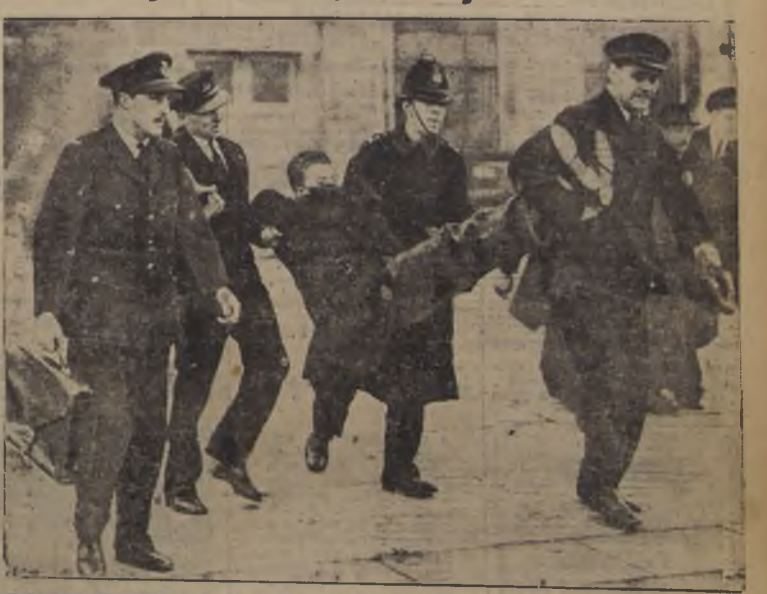
Tal es en síntesis la escena que representa nuestro grabado. Un fugitivo judío checoslovaco llegó a Londres contraviniendo las disposiciones vigentes, y tuvo que expulsarse. Pero el hombre era portado y robusto. Fueron necesarios para echarlo un "body" (guardian) y tres aviadores, que tuvieron que llevarlo, como se ve

Cuatro para uno; uno para cuatro Tal es en síntesis la escena que representa nuestro grabado. Un fugitivo judío checoslovaco llegó a Londres contraviniendo las disposiciones vigentes, y tuvo que expulsarse. Pero el hombre era portado y robusto. Fueron necesarios para echarlo un "body" (guardian) y tres aviadores, que tuvieron que llevarlo, como se ve