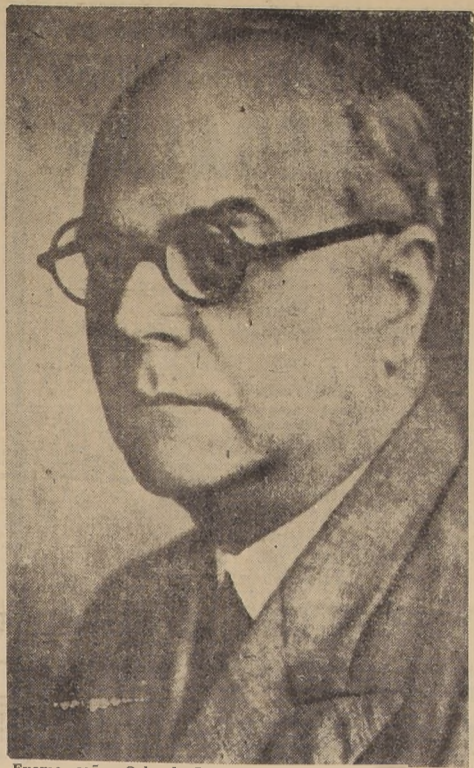
Excmo. señor Orlando Freyre y Cisneros, Ministro de Cuba en Chile