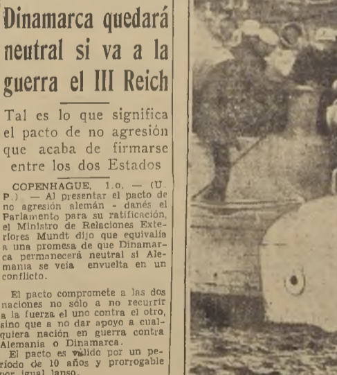
Cinco de los sobrevivientes salvados del submarino por medio de la "campana" de salvamento.

EL SALVAMENTO DE LOS TRIPULANTES DEL "SQUALUS".