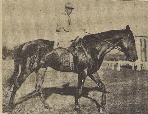
Alcatraz, el veloz hijo de Oakland, que se perfila como favorito en el clásico "Domingo de Toro Herrera"

SEPTIMA CARRERA.—1.200 METROS. CONDOR 53, P. Flores.—Llegó cuarto en la competencia que nos induce a recomendarla para uno de los placés.