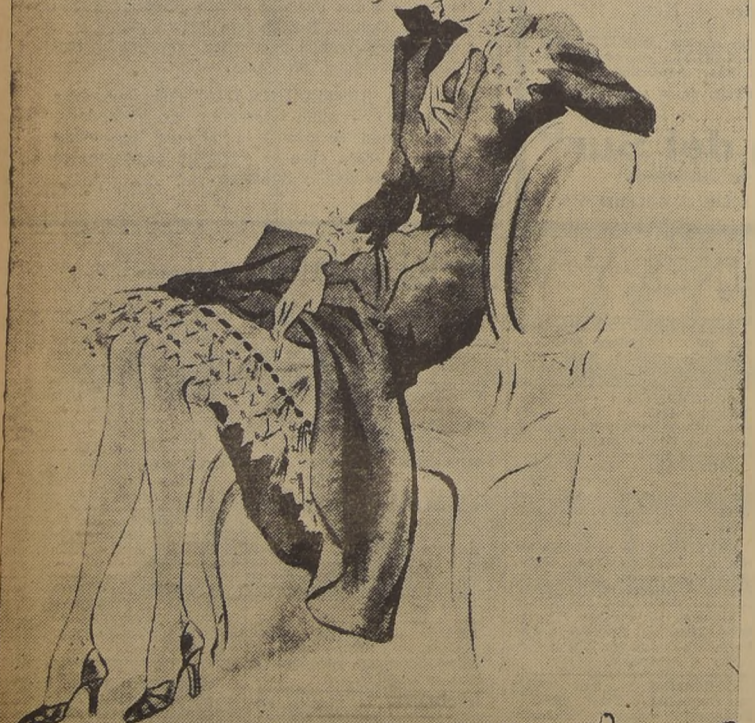
ROBERT FIGUET—Vestido de faya negra con puños y cuello de broderie blanca. Enagua amplia con volados y cinta de terciopelo negro pasada por las cuentas que sujetan el volado.