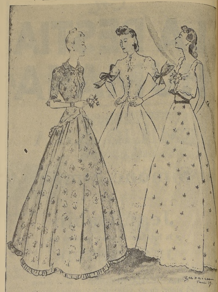
(Izquierda) BALENCIAGA.—Traje de dos piezas para comida; falda amplia y chaqueta pepló adornada con volados de broderie sobre viso de faya armada. (Centro) BALENCIAGA.—Vestido de noche, de linón blanco con franjas de broderie en la falda; chaqueta, también de broderie, con cinta de tafetas rosado que van atadas en los brazos. (Derecha) CHANEL.—Conjunto para la noche con bolero, en ondas, de linón blanco bordado, y flores de lo mismo en el escote.