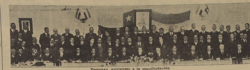
Personas asistentes a la manifestación