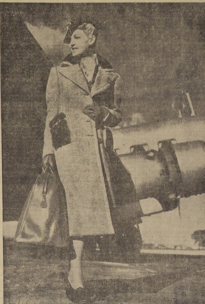
Lindo abrigo en lana diagonal beige, cuello y puños en piel de castor. Echarpe de Rodier, saco de viaje de la casa Hermès de París.

Gateau de migas. — Tome miga de pan, desmiguela y pégala en una cacerola. Tenga 1/2 litro de crema hirviendo, vacie una parte en la cacerola, revuelva con una cuchara de palo, y se repone en el juego para espesarla. Agréguele la crema necesaria para espesarla, mantequilla, cáscara de limón, azúcar y una narigada de sal. Añada 50 gramos de pasas de corinto y dos huevos. Se pone todo en un molde enmantecado al horno.