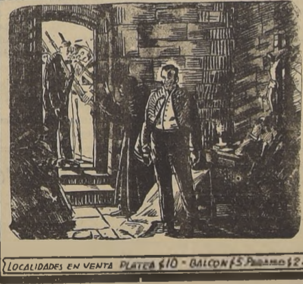
LOCALIDADES EN VENTA PLATEA $10 - BALCON $5.50

Martes próximo: El Gran Vals, Louise Rainer, a 3.40 y 2.40 localidades. Viernes semana próxima, estreno: Los Secretos de un Don Juan, Fredric March, Fronzo, La Ciudadela y Con los Brazos Abiertos.