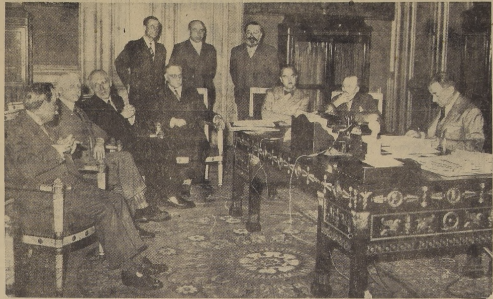
En el Ministerio de Hacienda se celebró recientemente en París una importante reunión que tenía por objeto reglamentar los beneficios de las empresas que trabajan para la Defensa Nacional. Sentado ante su escritorio, el Ministro de Hacienda Paul Reynaud, lee a los jefes de dichas fábricas y funcionarios de Hacienda su discurso