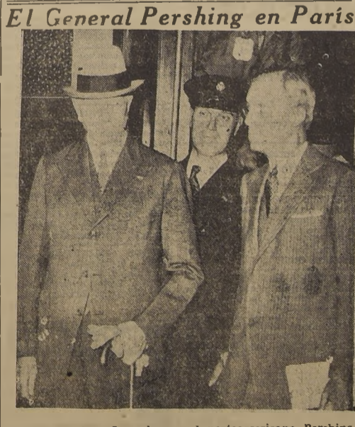
Como todos los años, el general norteamericano Pershing ha ido a Francia a inclinarse ante la tumba de sus compañeros muertos por Francia durante la guerra mundial. En este grabado aparece en el momento de su llegada a la estación de Saint Lazare, en la capital francesa

La situación no ha empeorado no obstante la mayor rigidez de las medidas tomadas por los nipones