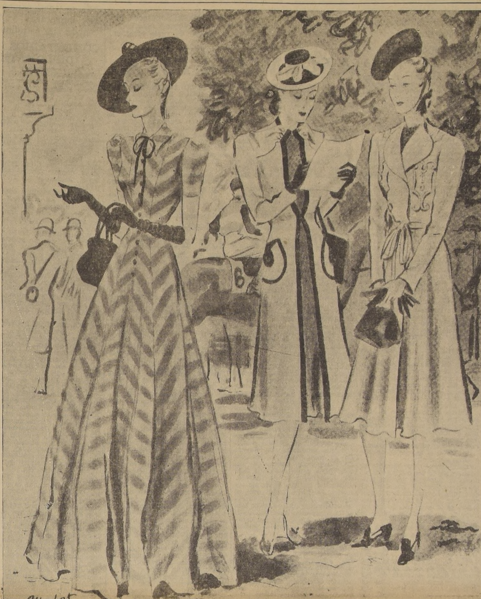
Tres novedosos y elegantes modelos para las carreras, y que seguramente tendrán gran aceptación: Amplio vestido hasta el tobillo en seda a rayas diagonal en tonos perla y bordeaux, sombrero, guantes y larteras bordeaux. Batina en lana negra, abrigo en lana color rosa viejo ribeteados de negro, sombrero negro y rosa viejo. Elegante abrigo color fucsia, vestido y sombrero azul claro.