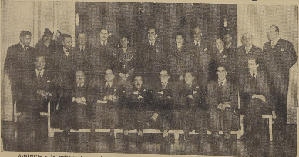
Asistentes a la entrega de premios en el concurso abierto por el Instituto de Información Campesina

A las 17.30 horas de ayer, se llevó a efecto en el Círculo de Información Campesina, con motivo de la entrega de los premios a los concursantes premiados en el certamen literario reciente, abierto por este organismo, a fin de que los escritores chilenos escriban para el campo y no sobre el campo.