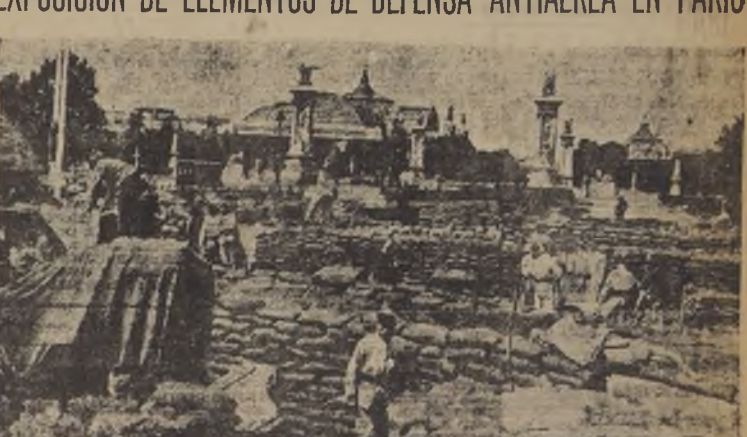
En la explanada de los Inválidos, de París, se inauguró una muestra de equipos para la defensa de esa capital, como lo muestra el grabado.