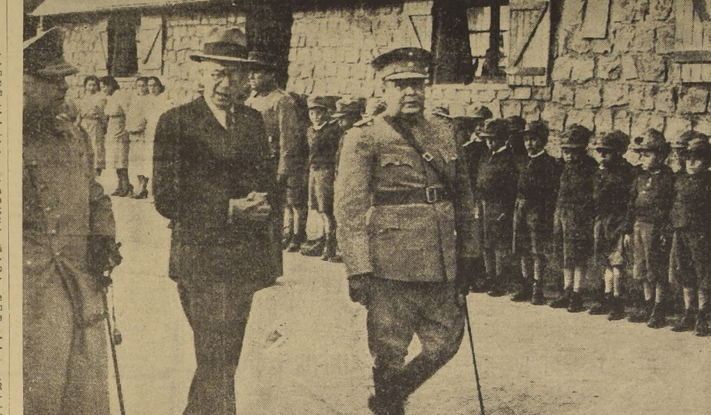
El Ministro de Defensa señor Labarca, el Comandante en Jefe del Ejército, general Fuentes, y el coronel señor Valenzuela durante la visita al Preventorio Infantil de Peñalolén