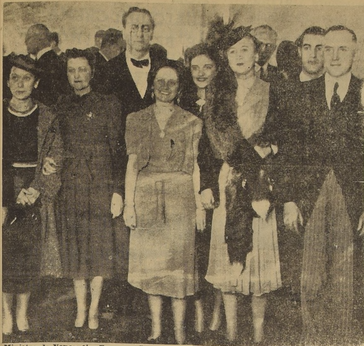
El Ministro de Venezuela, Excmo. señor Carnevali, y señora, acompañados de un grupo de invitados durante la recepción de ayer en la Legación, con motivo del aniversario nacional del país amigo.