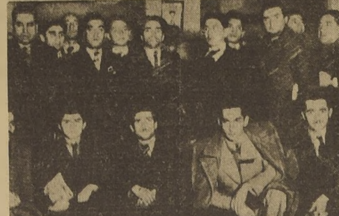
Dirigentes y miembros del Sindicato de Operadores de Teatros, que acordó llevar a cabo la huelga gremial...

El Sindicato del gremio la hará efectiva a diversos empresarios