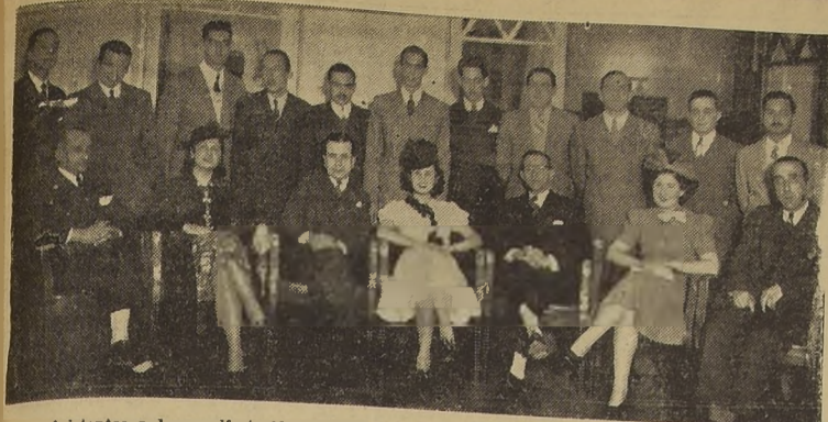
Asistentes a la manifestación ofrecida en los salones del Savoy, a la delegación de estudiantes de la Universidad de Sao Paulo (Brasil)...