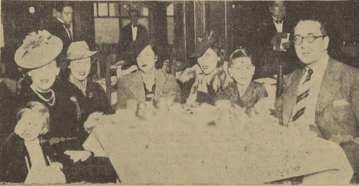
Un simpático grupo familiar en el Tea Room de Gath y Chaves en sus Viernes de Moda...