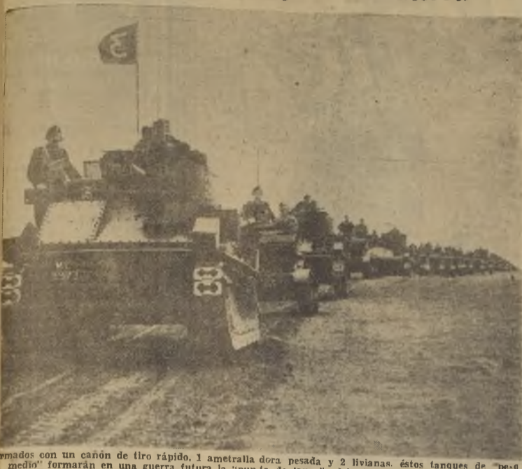
Armados con un cañón de tiro rápido, 1 ametralladora pesada y 2 livianas. éstos tanques de "peso medio" formarán en una guerra futura la "punta de lanza" del ataque del ejército inglés