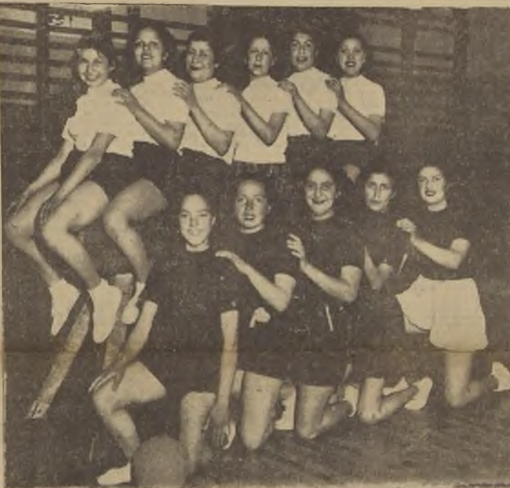
Las damas han manifestado también gran entusiasmo por estas actividades. Este curso funciona en el gimnasio del Liceo B. Borronovo

Buenos Aires, 6 (U. P.). — Los resultados de los partidos jugados hoy por el campeonato profesional de fútbol son los siguientes: San Lorenzo 1, Boca Juniors 0; Independiente 3, Racing 0; Ferrocarril Oeste 1, Huracán 0; Vélez Sarsfield 4, Argentinense 0; Quilmes 1, Platense 3; Old Boys 3, Tigre 1; Lanús 0, Rosario Central 2; Chacarita Juniors 1; River Plate 2; Gimnasia y Esgrima 1; Estudiantes 3; Atlanta 1.