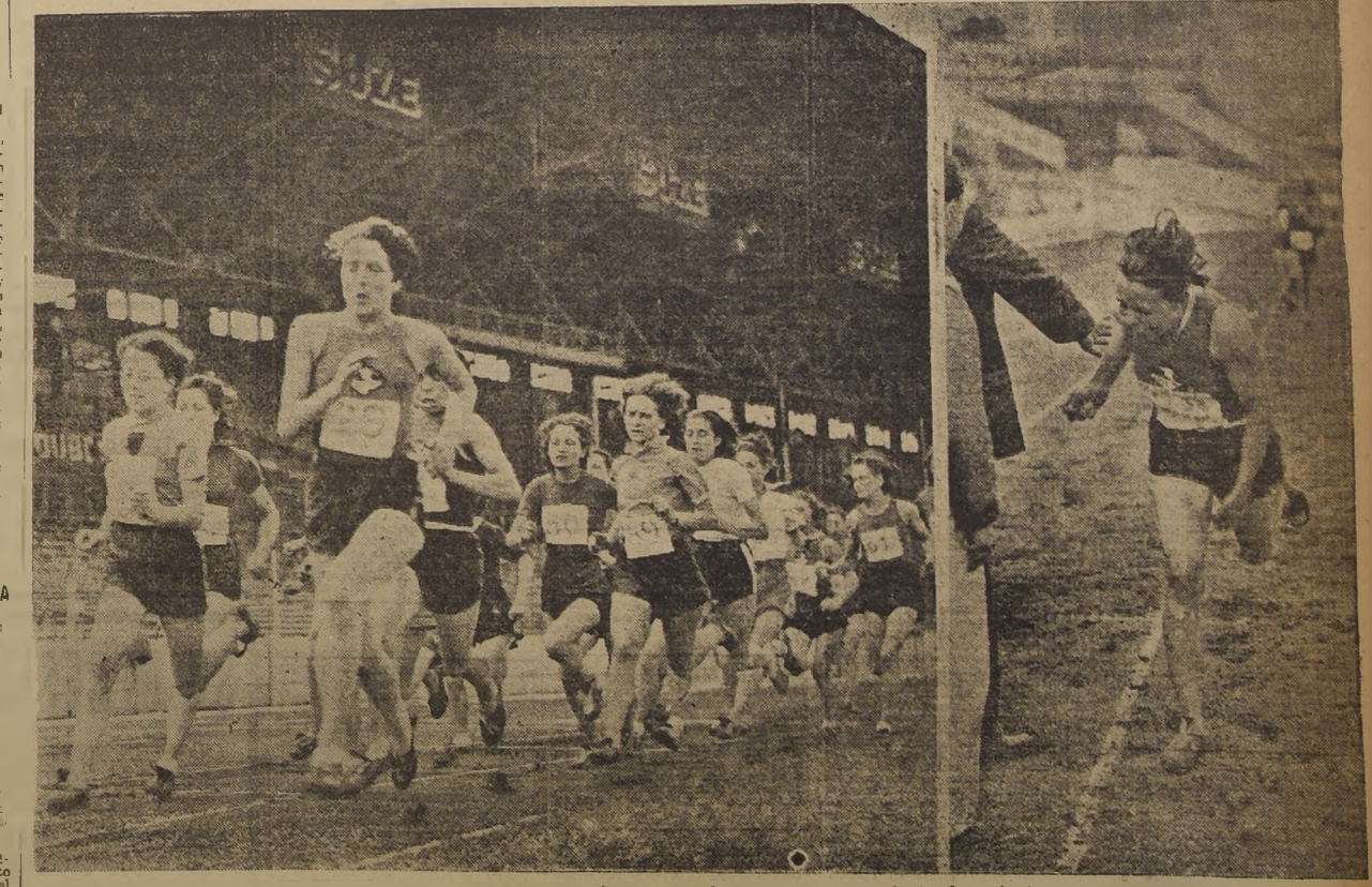
Muestran estas instantáneas dos aspectos de la carrera de 800 metros planos, para damas, efectuada recientemente en Colombes (Francia).