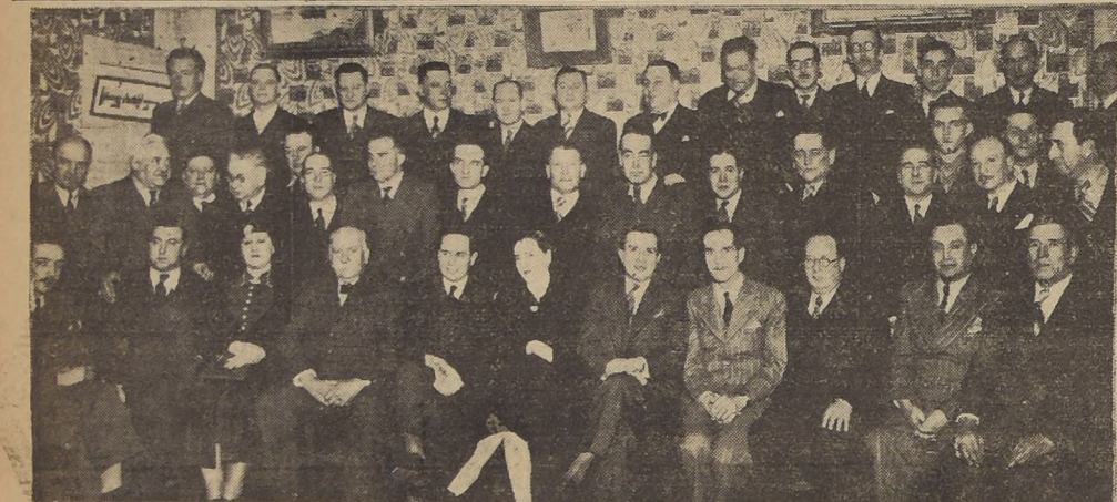
Asistentes a la comida que sus compatriotas y amigos ofrecieron antecede en el Club Coquimbo-Atacama al Ministro de Chile en Francia don Gabriel González Videla y señora