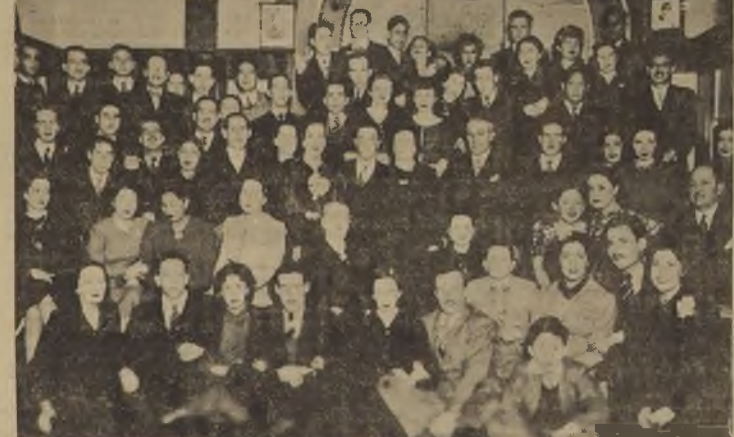
Asistentes al baile organizado por los estudiantes bolivianos con motivo del aniversario de su independencia nacional.