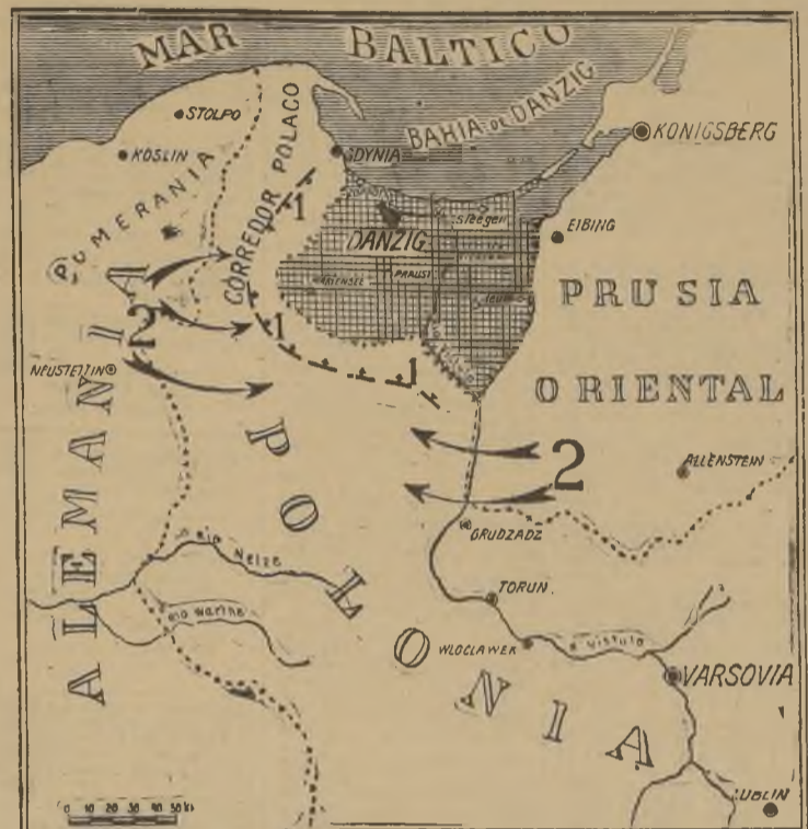
La parte cuadrículada indica el circuito que abarca la Ciudad Libre de Danzig. Los números indican: 1, la posible posición de las tropas polacas...