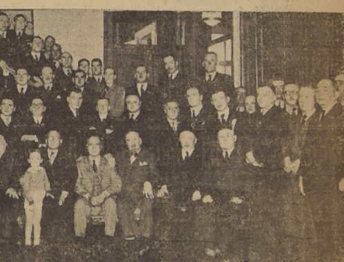
Asistentes al banquete con que la colonia vasca residente celebró este año las fiestas de San Ignacio. Este acto, número principal del programa de festejos, se efectuó en un ambiente de grande entusiasmo.