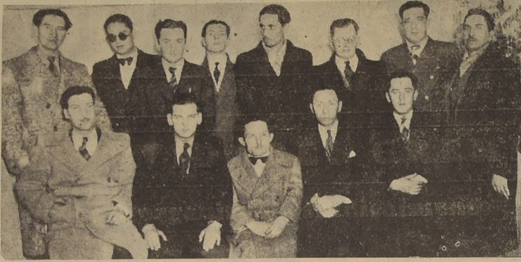
El Directorio y socios fundadores del Sindicato Profesional de Propagandistas de Ramos Comerciales, organización que se propone desarrollar interesantes actividades en favor del gremio.