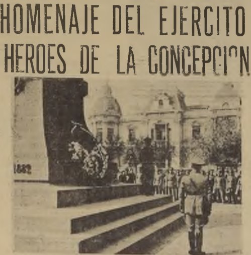
Un aspecto del acto de ayer en el Monumento a los Héroes de la Concepción.

Temporal cortó las comunicaciones con provincias del Sur El período de mal tiempo continuará desarrollándose en el país