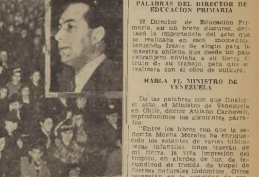
Parte de la concurrencia al acto de ayer en el Municipal. En el ángulo, el Ministro de Educación, don Rudecindo Ortega, pronunciando su discurso.