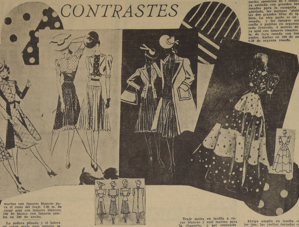
marino con lunares blancos para el resto del traje. 2.80 m. de crepé azul con lunares blancos; 1.60 de blanco con lunares azules en 100 de ancho.

Traje de tarde en crepé de China blanco con lunares azul marino para la parte de arriba, las mangas y el dobladillo, y azul