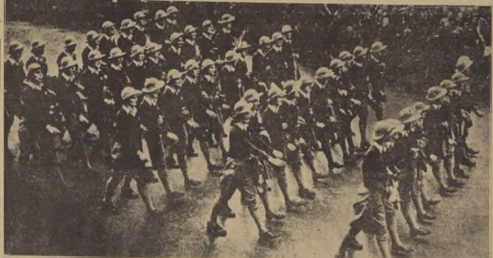
Estas simpáticas voluntarias, que en caso de guerra reemplazarán a los trabajadores de los campos ingleses, desfilan, correctamente uniformadas, por las calles de Londres durante una reciente revista militar.