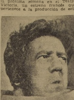
Michel Simon, figura característica de la pantalla francesa

Sterling Pictures anuncia para la próxima semana en el Teatro Victoria, un estreno francés que pertenece a la producción de este Tribunal Francés es, en verdad, uno de los recursos usuales y gastados de esa cinematografía parisiense que fatigantemente aparece la justicia por alguna parte. En esta chispeante comedia el Tribunal tiene un aspecto nuevo, un aspecto cómico que provoca risa y entusiasmo en los auditores.