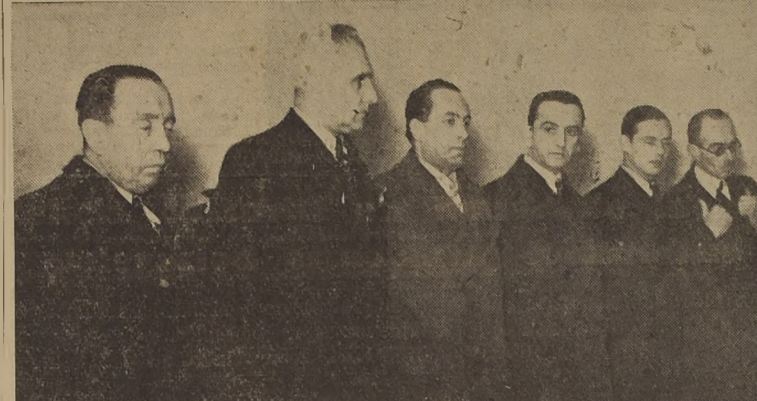
Durante la velada en honor de los estudiantes colombianos

Se efectuó ayer en la Universidad de Chile, con asistencia del Ministro de Educación y representantes diplomáticos