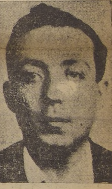
Don Justiniano Sotomayor