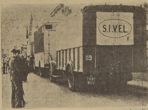
Camiones blindados en que se transportó el oro devuelto recientemente por Francia a España. Fotografía tomada después de haber atravesado la frontera la columna de camiones

las cuatro víctimas como patriotas a quienes, presuntamente, Gran Bretaña trataría como refugiados políticos. Los británicos esperan que Japón se abstenga ahora de la campaña anti-británica en China y levante el bloqueo de la concesión de Tien-tsin.