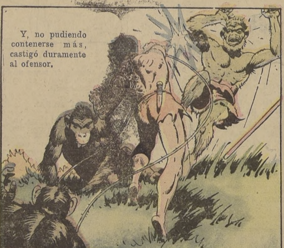
Y, no pudiendo contenerse más, castigó duramente al ofensor.