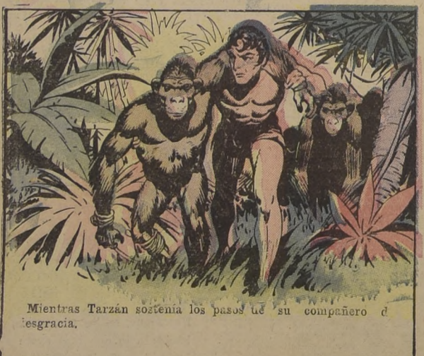
Mientras Tarzán sostenía los pasos de su compañero de desgracia.