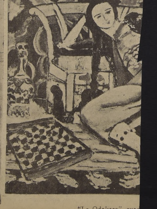
"La Odalisca", cuadro de Picasso

...de la historia de la pintura... Y que período sin duda más brillante de cuantos se conocen. Es en el último siglo, sobre todo en los últimos treinta años, donde el arte ha dado más de sí en cuanto a fantasía y expresiones de toda, que se refiere. Casi podríamos decir que cada uno ha formado escuela, aunque en el fondo, entre ellas tanta relación el resultado de las ideas que tan en un mismo ambiente atmosférico de la época que respiran. En arte, y acaso por la libe de que el hombre ha venido frutando, este último siglo, ha sido de revolución: tenemos evidencia, contemplando obras, que son una manifestación bien clara de la independencia que aún estamos viviendo, y de en múltiples facetas por ver aspectos de nuestra moderna sensibilidad. La revolución empieza con David, de quien podemos rescatar seis retratos, entre los que encuentra su célebre "Papa VII", sobrio, de gran dignidad. Ingres tenemos, entre "El Baño Turco", proveniente del Museo del Louvre, y que nuestro a través de las ducciones; de Corot, "La Pensativa", que, más que miniatra es una joya, y