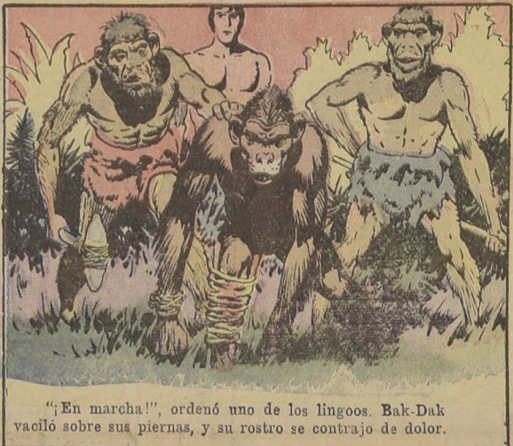
"¡En marcha!", ordenó uno de los lingoos. Bak-Dak vaciló sobre sus piernas, y su rostro se contrajo de dolor.