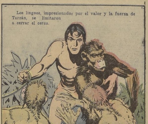
Los lingoos, impresionados por el valor y la fuerza de Tarzán, se limitaron a cerrar el cerco.