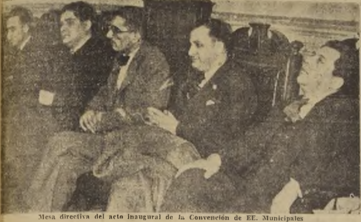
Mesa directiva del acto inaugural de la Convención de EE. Municipales

En la tarde de ayer se llevó a efecto en el Salón de Honor de la Universidad de Chile, el acto inaugural de la Convención de Empleados Municipales de la República.