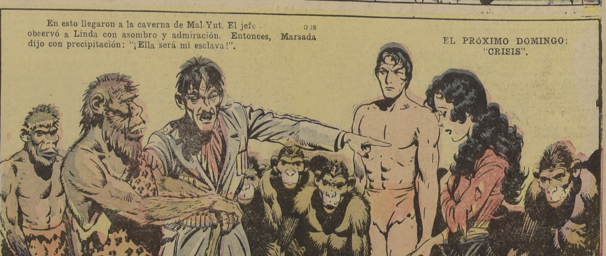
En esto llegaron a la caverna de Mal-Yut. El jefe observó a Linda con asombro y admiración. Entonces, Marsada dijo con precipitación: "¡Ella será mi esclava!".