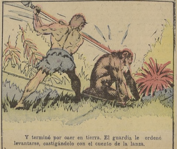
Y terminó por caer en tierra. El guardia le ordenó levantarse, castigándolo con el cuento de la lanza.