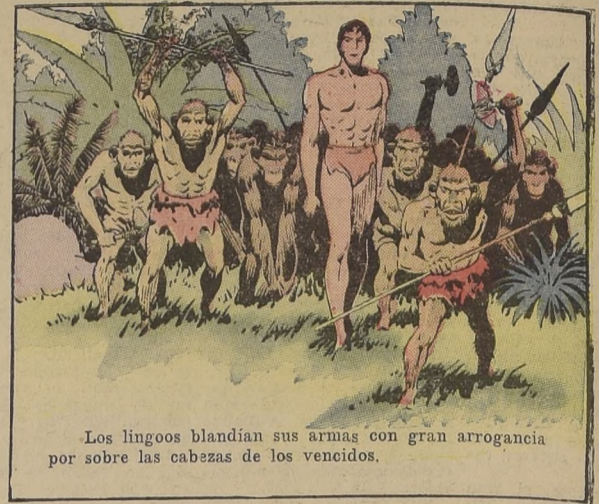
Los lingoos blandían sus armas con gran arrogancia por sobre las cabezas de los vencidos.