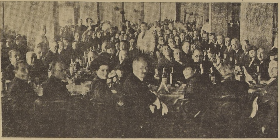
Mesa de honor del almuerzo de ayer a don Gabriel González Videla

MAS DE MIL PERSONAS CONCURRIERON AL HOMENAJE