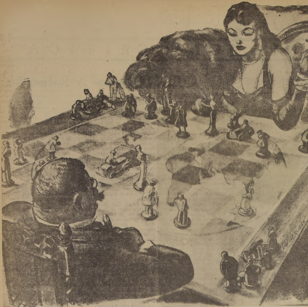
Jugadores y piezas en la gran partida mundial de espías y contraespías

Traducido especialmente para "LA NACION", por M. M. por Pierre Brel