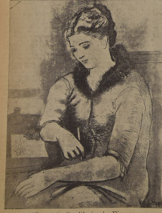
"Pensativa", dibujo de Picasso