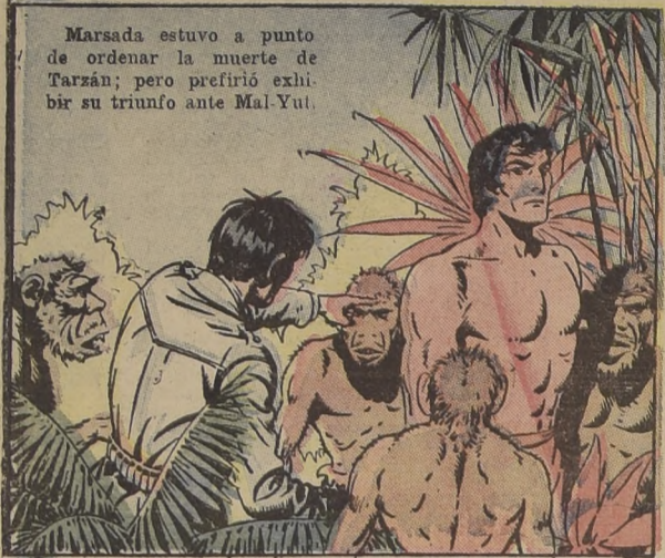
Marsada estuvo a punto de ordenar la muerte de Tarzán; pero prefirió exhibir su triunfo ante Mal-Yut.

Copyright Edgar Rice Burroughs, Inc.—The New York, N. Y. U. S. Pat. Office Produced by Famous Players-Lasker Corp., Distributed by UNITED FEATURE SYNDICATE, Inc.