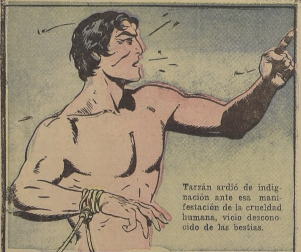
Tarzán ardió de indignación ante esa manifestación de la crueldad humana, vicio desconocido de las bestias.