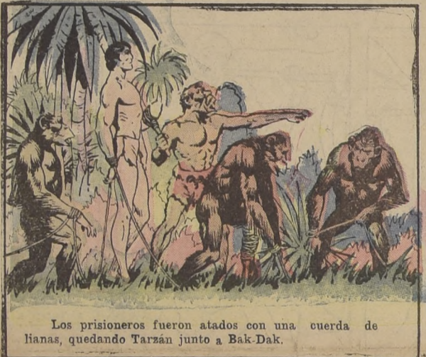
Los prisioneros fueron atados con una cuerda de huanas, quedando Tarzán junto a Bak-Dak.