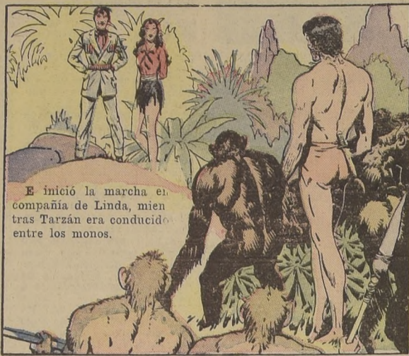
E inició la marcha en compañía de Linda, mientras Tarzán era conducido entre los monos.