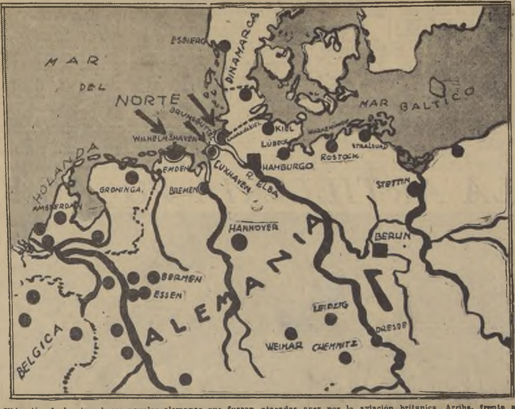
Ubicación de las tres bases navales alemanas que fueron atacadas ayer por la aviación británica. Arriba, frente a Bremerhaven, queda el puerto danés de Esbjerg, bombardeado por misterioso aeroplano

NUEVA YORK, 5 (U. P.) (Urgente).— La radio DNB de esta ciudad anuncia que estaba recibiendo una transmisión de París, cuando, sin explicación, esta fue interrumpida. Lo cual extrañó al speaker que escuchaba, ya que las condiciones atmosféricas eran buenas. Añadió el speaker que estimaba que se había ordenado el oscurecimiento de la ciudad, y que todos los operadores de la radio habían ido a refugiarse a los abrigos subterráneos. PARIS, martes 5 (U. P.) (Urgente).— La primera alarma contra incursiones aéreas de la guerra fue dada en esta ciudad a las 3.30 de la madrugada de hoy martes. PARIS, martes 5 (U. P.) (Urgente).— Las sirenas que deben dar la señal del término de la incursión aérea aún no habían sonado a las 6 de la mañana. Disparos de cañones anti-aéreos fueron oídos por corto tiempo a las 5 horas. AMSTERDAM, 4 (U. P.) (Urgente).— Se anuncia oficialmente que las baterías anti-aéreas abrieron el fuego contra algunos aviones de nacionalidad desconocida. PARIS, martes 5 (U. P.) (Urgente).— Las sirenas anunciaron que había terminado el peligro de incursión aérea a las 7 de la mañana. En consecuencia, la alarma duró 3 horas y media.