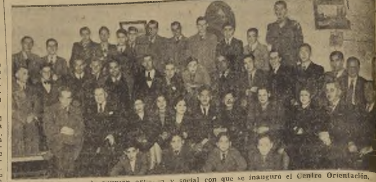
Asistentes a la reunión artística y social con que se inauguró el Centro Orientación.

Asistió al acto numerosa concurrencia de socios y sus familias.— Los oradores