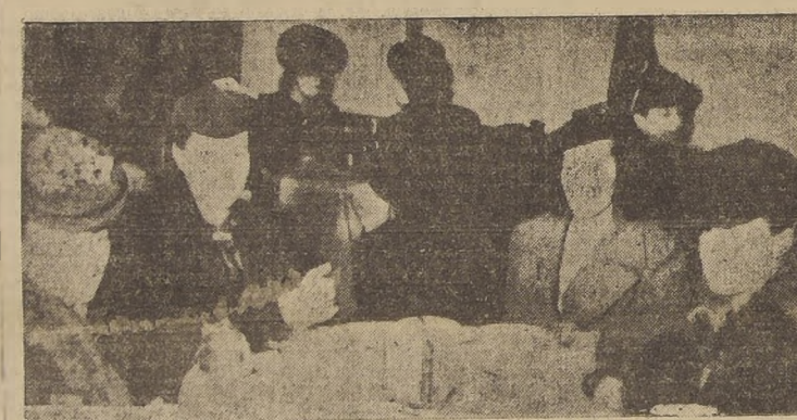
Algunas damas asistentes a los Viernes de Moda en el Tea Room de Gath y Chaves