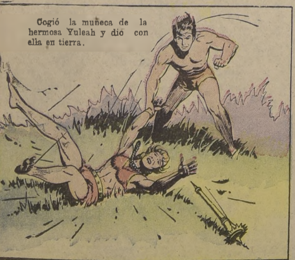
Cogió la muñeca de la hermosa Yuleah y dió con ella en tierra.