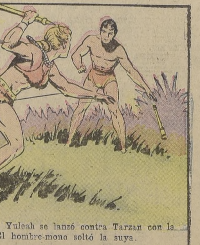
A una señal, Yuleah se lanzó contra Tarzan con la maza en alto. El hombre-mono soltó la suya.