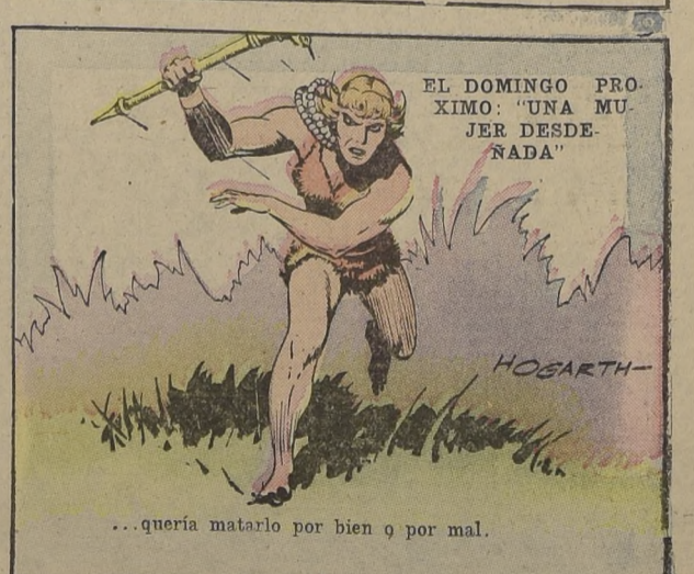
EL DOMINGO PROXIMO: "UNA MUJER DESDENADA"