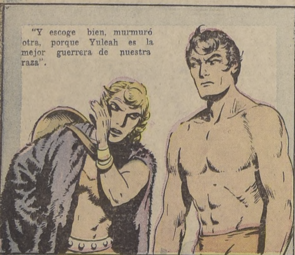
"Y escoge bien, murmuró otra, porque Yuleah es la mejor guerrera de nuestra raza".