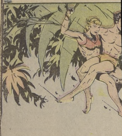
En seguida cogió a Tarzan y lo transportó a través de los árboles. El amo de la selva no opuso resistencia.