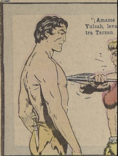
"¡Amame Yuleah, levánta tra Tarzan."