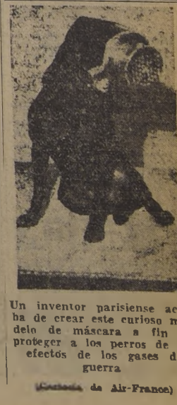
Un inventor parisense acaba de crear este curioso modelo de máscara a fin de proteger a los perros de los efectos de los gases de guerra.