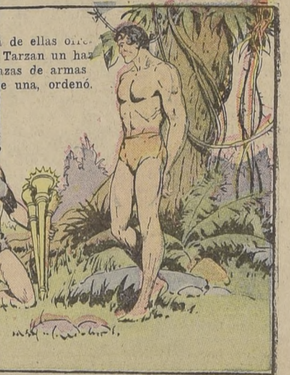
de ellas oír... Tarzan un haz de armas... una, ordenó.