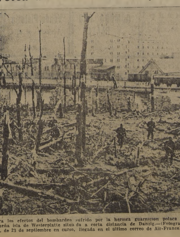
El presente grabado muestra los efectos del bombardeo sufrido por la heroica guarnición polaca que tuvo a su cargo la defensa de la pequeña isla de Westerplatte situada a corta distancia de Danzig.