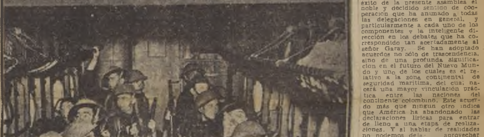
Soldados de la infantería británica trasladándose de un punto a otro en gigantescos aviones de pasajeros, a los cuales han sido colocados bancas 2 lo largo del fuselaje a fin de que den cabida a más viajeros