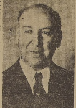
Senador don Marmaduke Grove, Secretario General del Partido Socialista, que ha recibido numerosas felicitaciones de todo el país, con motivo de su reciente designación.

Hablarán el senador don Marmaduke Grove, y los Ministros, señores Schnake, Allende y Merino CONCENTRACIONES EN SANTIAGO, VALPARAISO Y CONCEPCION El Comité Central del Partido Socialista ha acordado realizar grandes concentraciones populares en las ciudades de Valparaíso, Concepción y el próximo domingo y en ella hablarán los señores señores Oscar Schnake, Salvador Allende y Rolando Merino. Actos similares se verificarán en los días 12 en Concepción y el domingo 15 en Valparaíso.