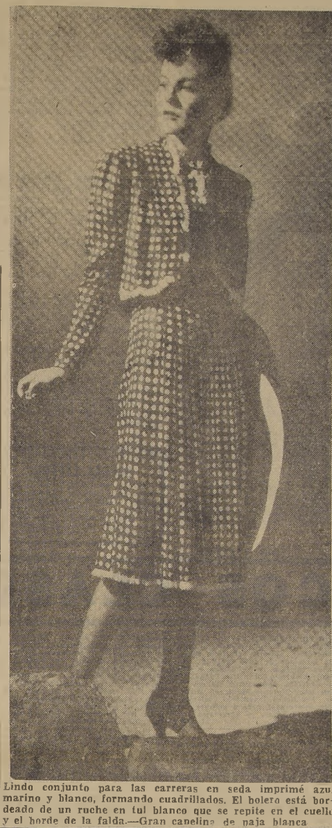
Lindo conjunto para las carreras en seda imprimé azul marino y blanco, formando cuadrillados. El bolero está bordado de un ruche en tul blanco que se repite en el cuello y el borde de la falda.—Gran cauelina de paja blanca.