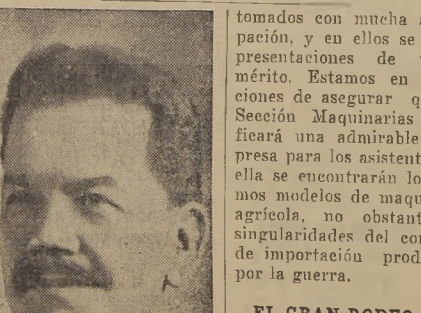
S. E. don Pedro Aguirre Cerda, que ha donado un valioso premio para el conquistador del título de Champion del Gran Rodeo Nacional

En el Casino del Chilea ocupa la Exposición de Animales, se celebrará la tradicional Fiesta Chilena, en la que se efectuarán concursos de tonadas, de canciones folklóricas y de bailes nacionales. Este año no será posible disponer del concurso de los Cuatro Huasos, conjunto exclusivo de la Radio Sociedad Nacional de