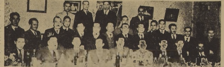
Asistieron a la brillante manifestación de simpatía ofrecida anteayer por miembros del 'Sindicato Profesional de Industriales en Calzado'...