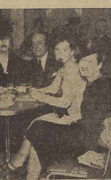
Diversos aspectos durante las reuniones sociales del "Cafe Esplanade", que se ha inaugurado con extraordinario brillo