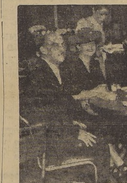
Diversos aspectos durante las reuniones sociales del "Cafe Esplanade", que se ha inaugurado con extraordinario brillo