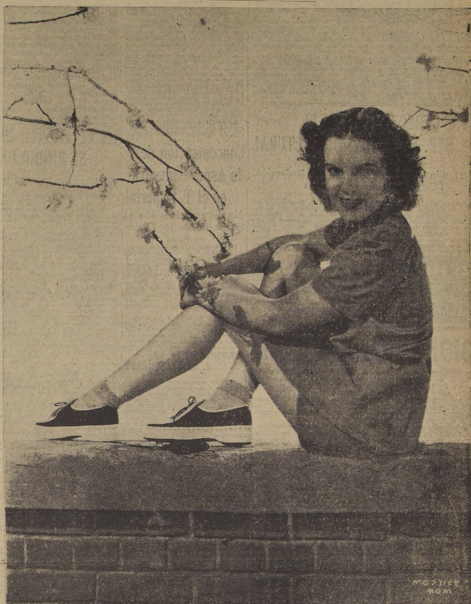
Judy Garland, juvenil artista y cantante de los estudios Metro Goldwyn Mayer y una de las principales intérpretes de la maravillosa película "EL MAGO DE OZ", que ha inspirado este nuevo Concurso, que iniciará el Teatro Metro con nuestro diario "La Nación".

Esta vez la competencia está dedicada al alumnado de colegios y liceos.—Este nuevo Concurso está inspirado en la grandiosa película Metro Goldwyn Mayer, "El Mago de Oz", que estrenará pronto el Teatro Metro.—50 valiosos premios.—Las bases oficiales daremos a conocer en esta semana.