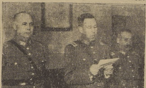
Durante la manifestación en la Escuela de Ingenieros Militares

Con motivo del aniversario de la creación del Arma de Ingenieros Militares, se llevó a efecto en la Escuela de Ingenieros Militares, a las 11.50 horas de ayer, una reunión de camaradería en conmemoración de esta fecha.