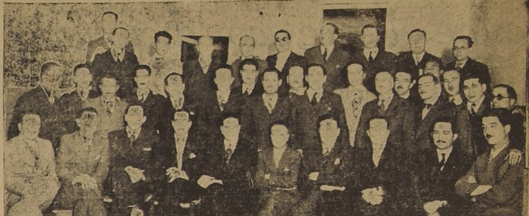
Asistentes a la manifestación ofrecida en el Club Coquimbo-Alcama, en honor del Ministro de Salubridad, doctor Salvador Allende, ofrecida por sus ex discípulos y miembros de la Federación de Estudiantes de Valparaíso.