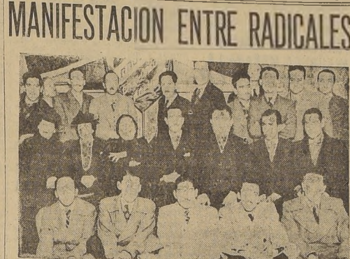
El Bloque Funcional Radical de la Caja de Crédito Popular...