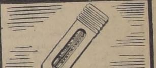
1.—TERMOMETRO INTEGRAL. En la parte interior de la puerta; muestra claramente la temperatura en el gabinete.