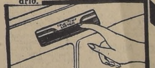
—REGULADOR "TRUE-TEMP". Escoga la temperatura deseada; ésta se mantendrá correcta automáticamente.