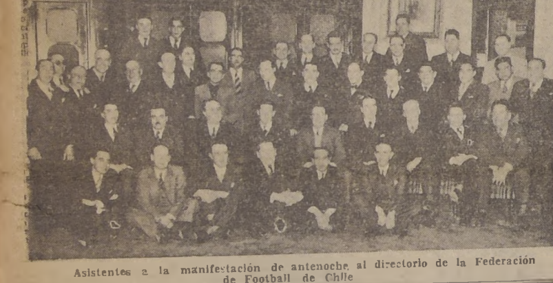
Asistentes a la manifestación de anteañoche al directorio de la Federación de Fútbol de Chile