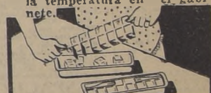
5.—CUBETAS "EJECT-O-CUBE". Con el Refrigerador Westinghouse se obtienen abundantes cubitos de hielo.