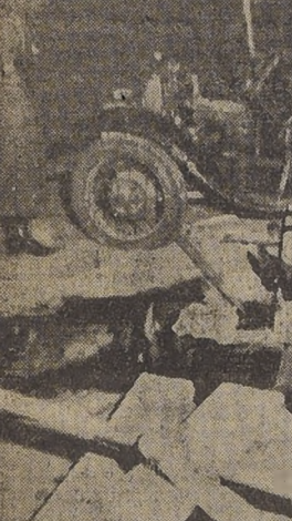
Las víctimas del accidente de la madrugada de ayer

Después de haber acudido el Juez del Crimen, se procedió a levantar los cadáveres y a trasladarlos al Instituto Médico Legal para su autopsia.