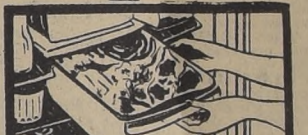
—BANDEJA GUARDA-CARNE. Para guardar fresca y jugosa por varios días hasta 7 kilos de carne.

LA CASA GRANDE O CHIQUITA DE WESTINGHOUSE NECESITA