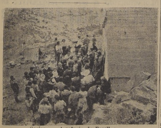
Socios en el refugio de Farellones