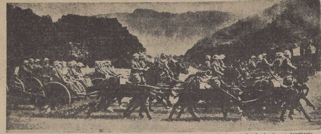
Artillería de la Confederación, que está lista para entrar en acción si el conflicto se extiende hasta su territorio...