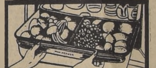
—GUARDA-VERDURAS ("Humidrawer"). Espacioso, también para frutas y legumbres... con tapa de vidrio.