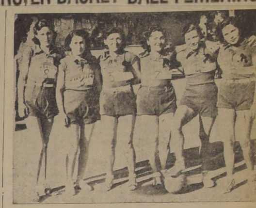
Equipo del Comercio Atlético, que venció ayer al Paraguay, debutando en la primera división

Con el resultado que se registró ayer, en la semifinal de la primera división del basketball femenino, resultó campeón de la temporada de 1939, el conjunto de la Universidad de Chile.