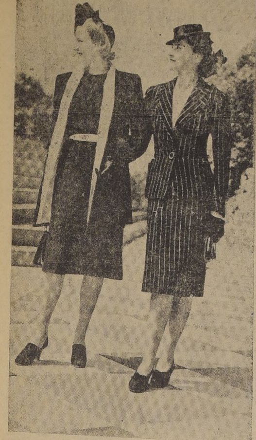
Negro y blanco es el furor de la moda de otoño en Londres