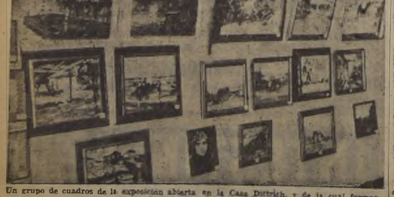
Un grupo de cuadros de la exposición abierta en la Casa Dietrich, y de la cual forman parte las mejores firmas chilenas.