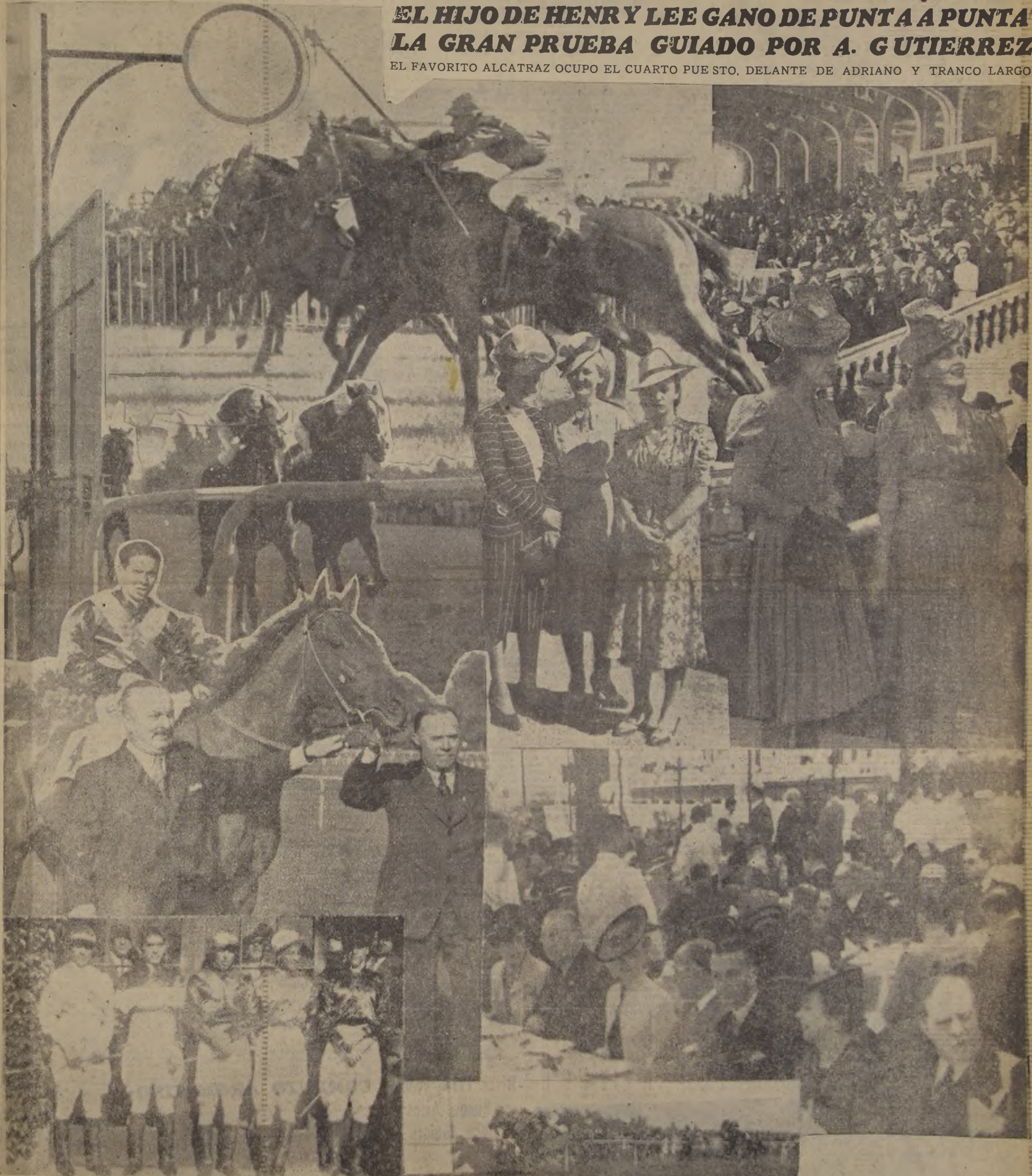
Arriba, la partida de "El Ensayo".—Más abajo, Fouché y Esperanto, luchando palmo a palmo antes del disco, y diversos aspectos de la reunión social de ayer con motivo de la gran carrera

EL FAVORITO ALCATRAZ OCUPÓ EL CUARTO PUESTO, DELANTE DE ADRIANO Y TRANCO LARGO