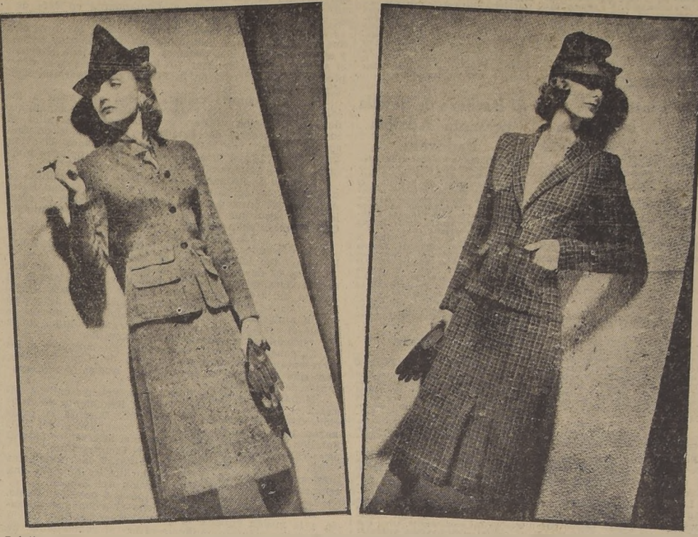
Prácticos y elegantes estos dos trajes para viaje o sport. El primero es en lana angora con lunares en color opuesto. La falda tiene un gran pliegue que la hace amplia y cómoda. El segundo es también en lana guardilla multicolor. Ambos sombreritos también son de gran novedad y elegancia.