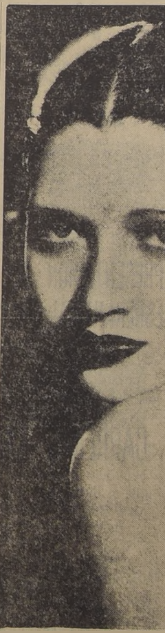
Kay Francis, estrella de R. K. O., que a su notable distinción personal une un gran temperamento dramático, y que ha sido considerada muy digna de ostentar el título de "actriz mejor vestida de la pantalla"

le Reynolds, Archie Mayo, veterano realizador tuvo a su cargo la dirección.