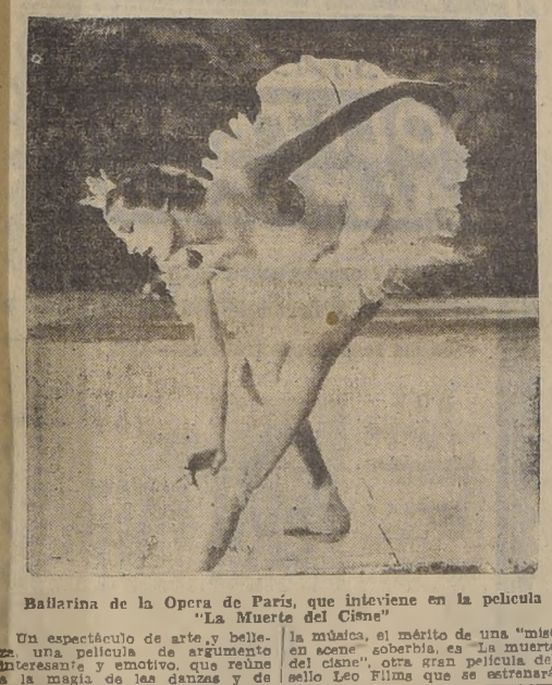
Ballerina de la Opera de París, que interviene en la película "La Muerte del Cisne".