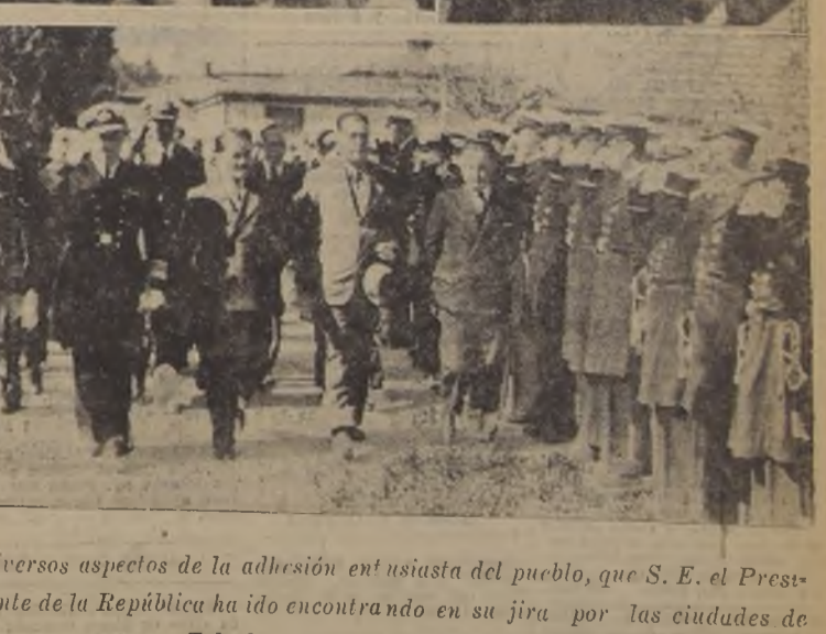
Diversos aspectos de la adhesión entusiasta del pueblo, que S. E. el Presidente de la República ha ido encontrando en su jira por las ciudades de Talcahuano, Tomé, Coronel y Penco.