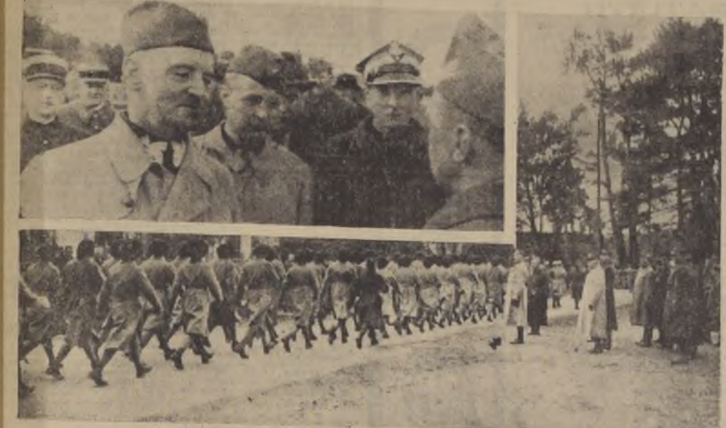
Tropas del nuevo ejército polaco, constituido en Francia, para luchar al lado de los aliados contra los alemanes. Las tropas son revistas por el general Sikorsky, jefe del ejército. — Arriba, Sikorsky conversa con oficiales franceses.